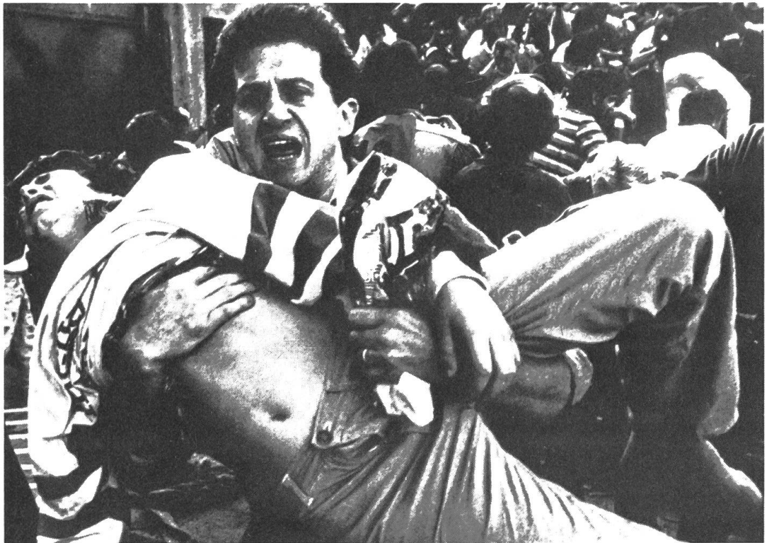
Musste die Show wirklich weitergehen? Nach den Toten und Verletzten der Juventus-Jubel.

die mit ihrer Arbeit ebenso allein blieben und sich überfordert fühlen mussten wie ihr Kollege Kurt Zurfluh im benachbarten Sportstudio, zeugt von einem eigenartigen journalistischen Berufsethos. Angesichts der dramatischen Entwicklung der Brüsseler Ereignisse und ihrer sozialen und politischen Bedeutung hätten sich verantwortungsbewusste Journalisten und Redaktoren ins Studio begeben müssen, ohne erst dazu aufgefordert zu werden. Doch was an jeder gut geführten Tageszeitung eine Selbstverständlichkeit ist, hat beim Deutschschweizer Fernsehen offenbar keine Geltung.