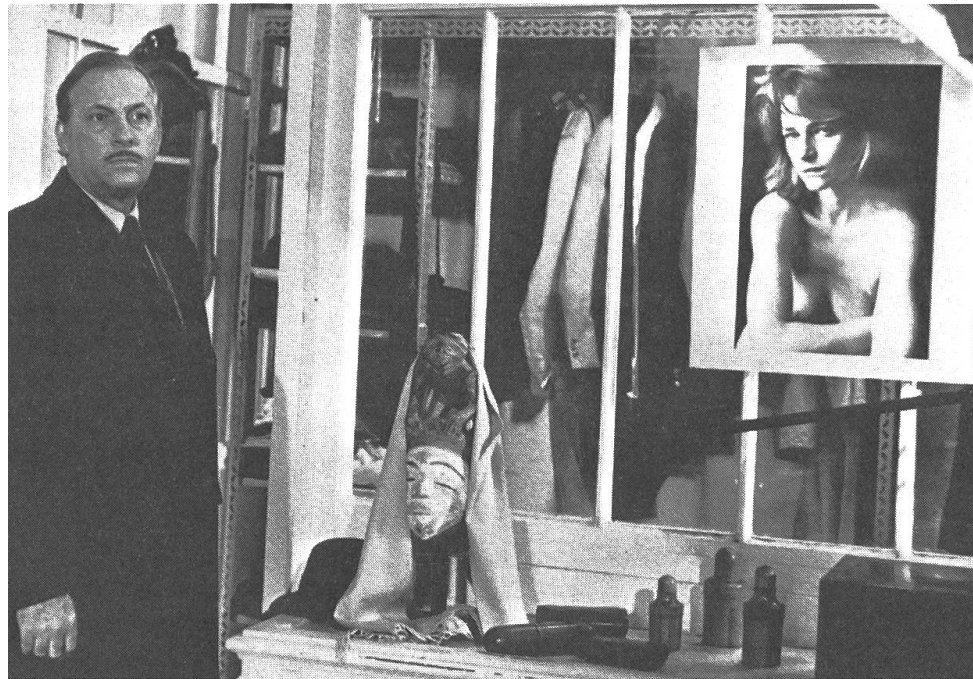
Michel Serrault und Charlotte Rampling in «On ne meurt que deux fois».

tation des «Poulet» (ein anderes Wort für «Flic») sehenswert ist. Wer gepflegte Unterhaltung mag, wird an «On ne meurt que deux fois» seine Freude haben – und ihn bald vergessen.