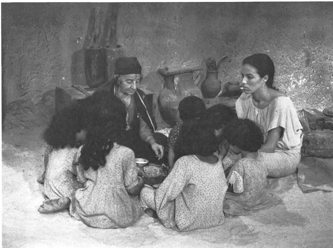
«Vent de sable»: archaisch-tragische Oper mit zögernder Hoffnung auf eine gerechte Zukunft.

gleichbar mit der unheimlichen Stille vor dem Orkan.