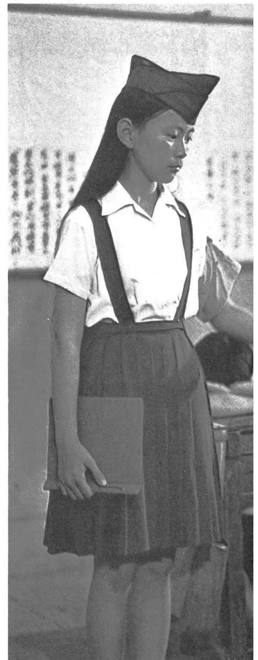
«In Our Time»: Vier Sketches von vier verschiedenen Regisseuren läuteten 1982 die neue Welle des Films in Taiwan ein.

Zwang der Zensur, der Taxierungen und Versteuerung auf importierten Filmen wurde etwas abgeschwächt, die Zensur des Drehbuchentwurfs aufgehoben. Vergessen ist die Bedingung, über Ethik und offizielle Politik zu wachen. «Bis anhin waren die Normen sehr streng», erklärt einer der Produzenten. «Es war zum Beispiel unmöglich, einen Übeltäter sterben zu lassen, bevor ihm nicht die Möglichkeit geboten wurde, zu bereuen.» Im Anschluss an diese Neuerungen werden Oscars für taiwanische Filme und Festivals, wie zum Beispiel die Taipei International Exhibition (1981), organi-