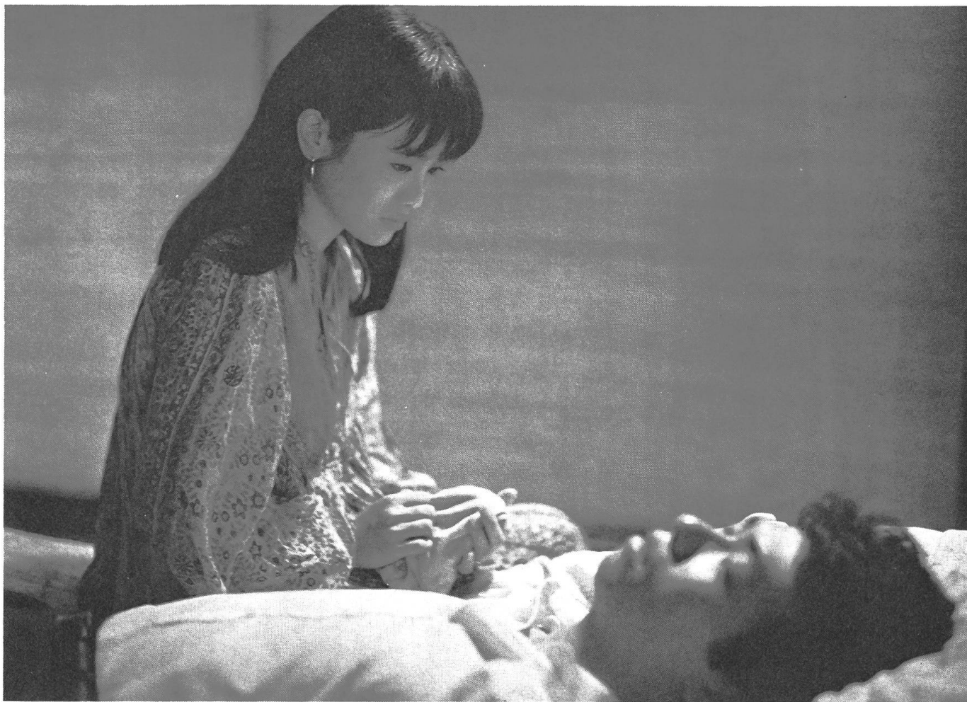
Aus «The Day on the Beach» von Edward Yang.

genen Filme wie « The Warmth in Winter », die auf der Insel den Beginn einer eigentlichen schöpferischen Phase markieren.» Die Filme waren eine erfolgreichere Annäherung an die Wirklichkeit als die scheuen politisch-poetisch-realistischen Versuche der CMPC, die sich mit grosser Naivität für die Probleme der unteren Klassen und der ländlichen Gegenden einsetzte. Aber die Filme werden kaum im Box-Office erwähnt, und Li Han-Hsiangs Firma geriet in Konkurs, nachdem sie um die zwanzig Filme hervorgebracht hatte.