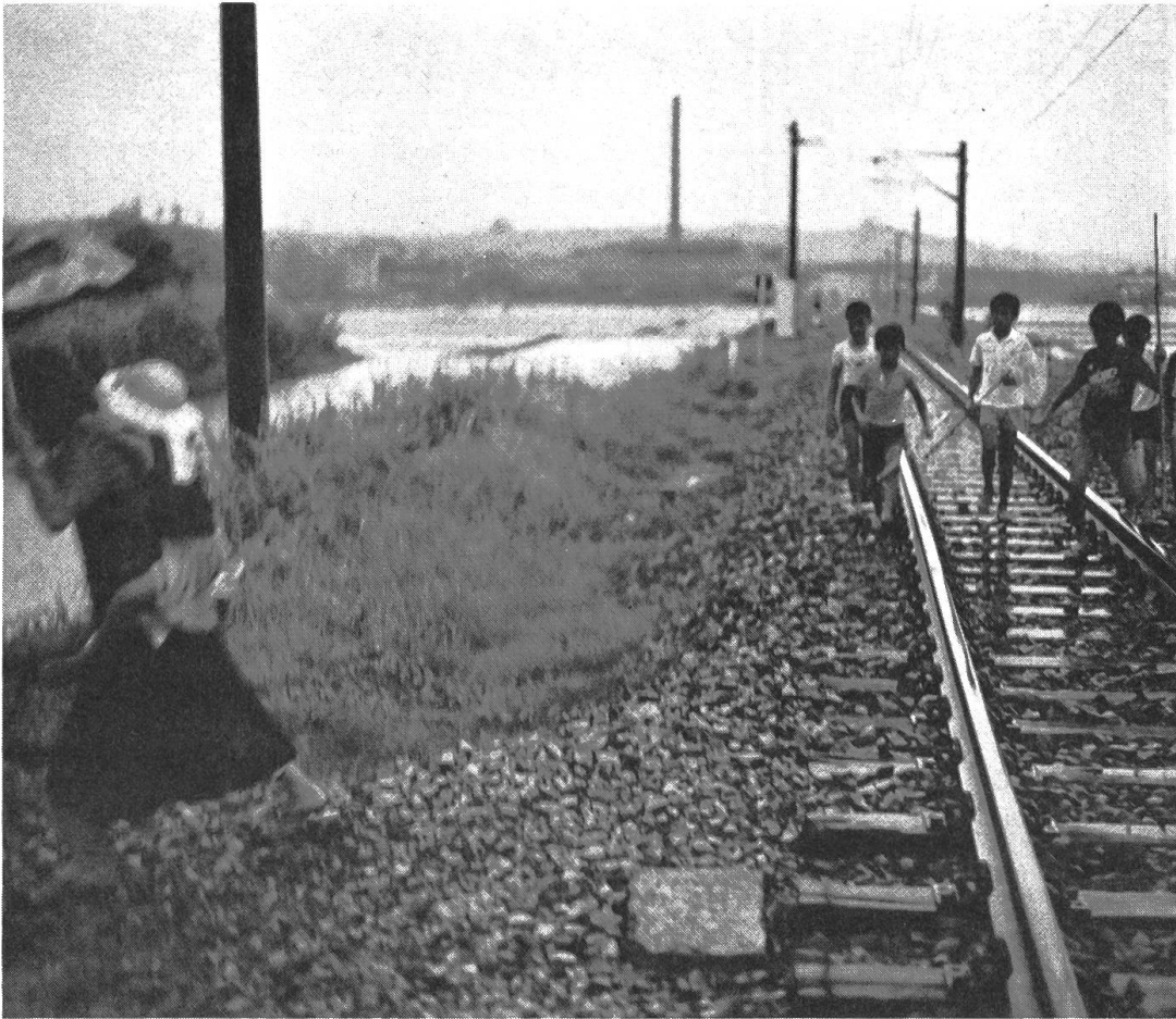
Aus «Dongdong de Jiaqi» (A Summer at Granpa's) von Hou Xiaoxian.

radfahrer, die ratternd das mit tausend Girlanden erstrahlende Denkmal Tschiang Kai-scheks umrunden.