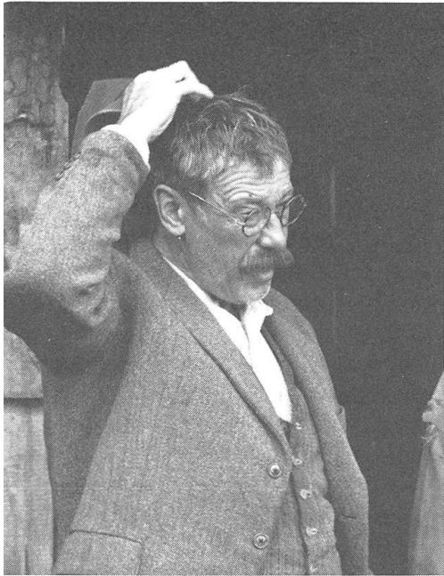
Kleine Glanzrolle: Dietmar Schönherr als Ackerbauleiter Steiner.

schaften hat, um die eigene Familie zu ernähren und den Überschuss andern zukommen zu lassen. Wenn er auf seinen steilen Hängen ackert, schwemmt der Regen die Erde weg, sodass es überhaupt keine Erträge mehr gibt. Tanner will sein eigener Herr und Meister bleiben. Er ist kein Untertan, dem eine ferne Obrigkeit («die in Bern oben») vorschreiben darf, was er zu tun und zu lassen habe.