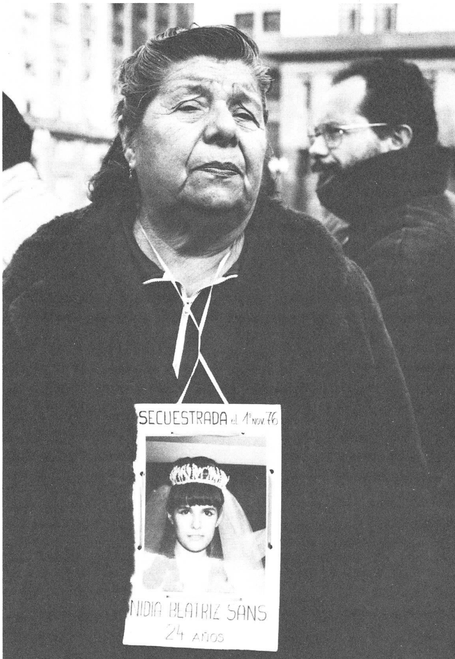
Argentinische Mutter sucht ihr Kind: «Las madres de Plaza de Mayo» von Susana Munoz und Lourdes Portillo.

scharf ihre Behauptung, sie dürfen nicht die Themen aufgreifen, die sie beschäftigen würden. Neidisch blicken sie nach Polen, wo heute Erstaunliches möglich ist. In Jadwiga Zajiceks Film «Welcher Weg führt zu den Menschen?» finden sich kriminalisierte Jugendliche zu ernstesten Gesprächen über ihre Lage zusammen. Ich erfahre, dass in Polen Heroinsüchtige polnisches Heroin spritzen.