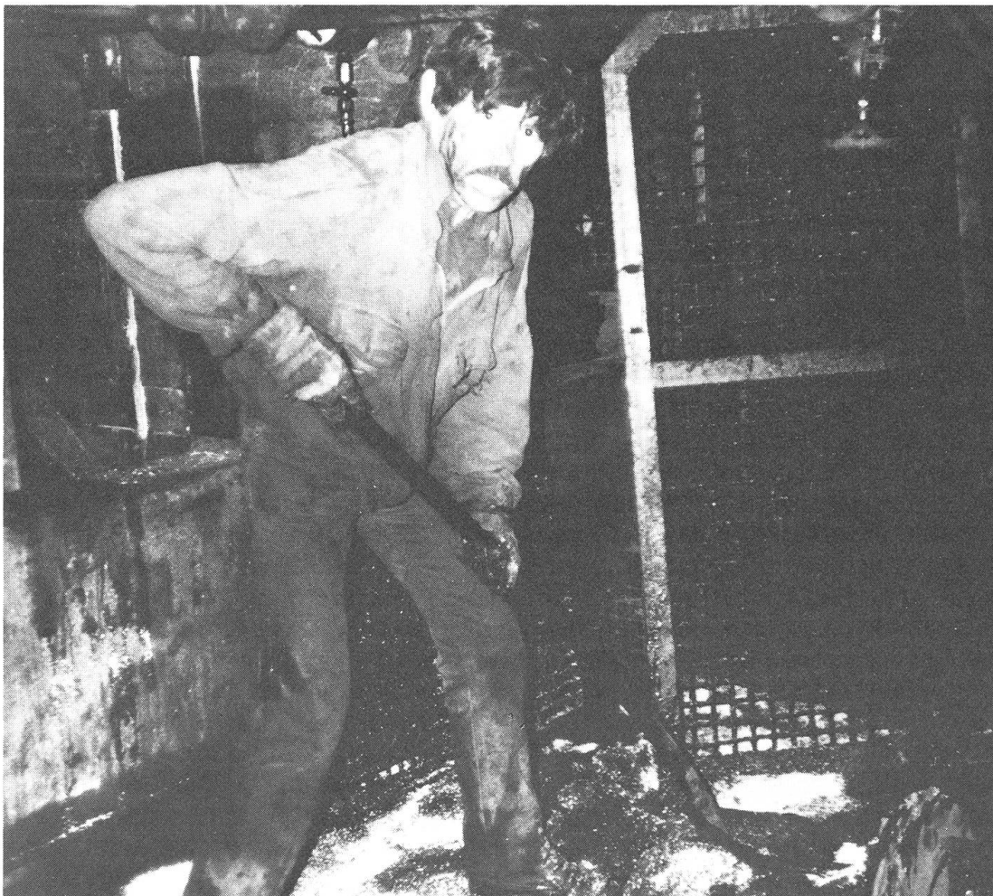
Günter Wallraff als malochender Türke Ali Levent.

(So ganz nebenbei hat Wallraff ja auch einen bitteren Schaubeweis geliefert, dass es sowas wie Lumpenproletariat überhaupt noch gibt. Das haben fortschrittlich-mittelständische Seelen [wie ich] immer wieder nötig, unsere grossen Bögen um Politik, Gesellschaft, Gefühlshygiene und Zukunft kommen ja glänzend ohne Klassenkategorien aus. Entsprechend selten sind Mitmenschen italienischer, türkischer, tamilischer Herkunft darin inbegriffen.) Bilder nicht von «Industrielandchaften» zeigt «Ganz unten», keine Veranschaulichungen von Sinnkrise oder Entfremdung, sondern erschütternde Dokumente körperlich zerstörender Arbeit und seelisch zerstörender Arbeitsverhältnisse. Welcher Film hat solches zuletzt gezeigt? Sagen wir's ganz klar: selten einer überhaupt je. Und das hat seine Gründe.