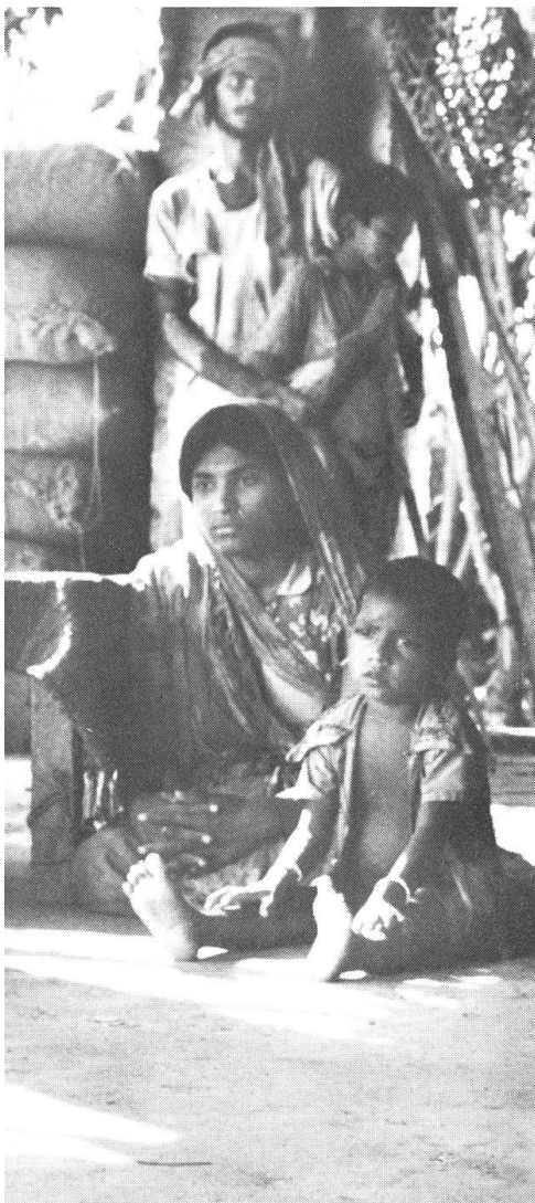
Aus « Damul » ( Tod durch den Strang ) von Prakash Jha.

Die Art und Weise, wie eine Gesellschaft mit ihren Kindern umgeht, lässt etwelche Rückschlüsse über ihren Zustand zu. So ist es wohl kein Zufall, dass in einer Zeit, in welcher der Film vermehrt als Mittel zur Reflexion sozialer Zustände eingesetzt wird, Filme mit Kinderschicksalen eine nicht unbedeutende Rolle spielen. Zur langen Reihe der Filme, die an der Berlinale diesbezüglich zu sehen waren, muss der südkoreanische Wettbewerbsbeitrag « Gilsodom » von Im Kwon-Taek im weitesten Sinne auch gerechnet werden. Um nach dem Koreakrieg vermisste Eltern, Söhne und Töchter geht es und um eine Aktion des Fernsehens auch, das auseinandergerissene Familien wieder zusammenführen will. Rührende Szenen spielen sich ab und werden live übertragen,