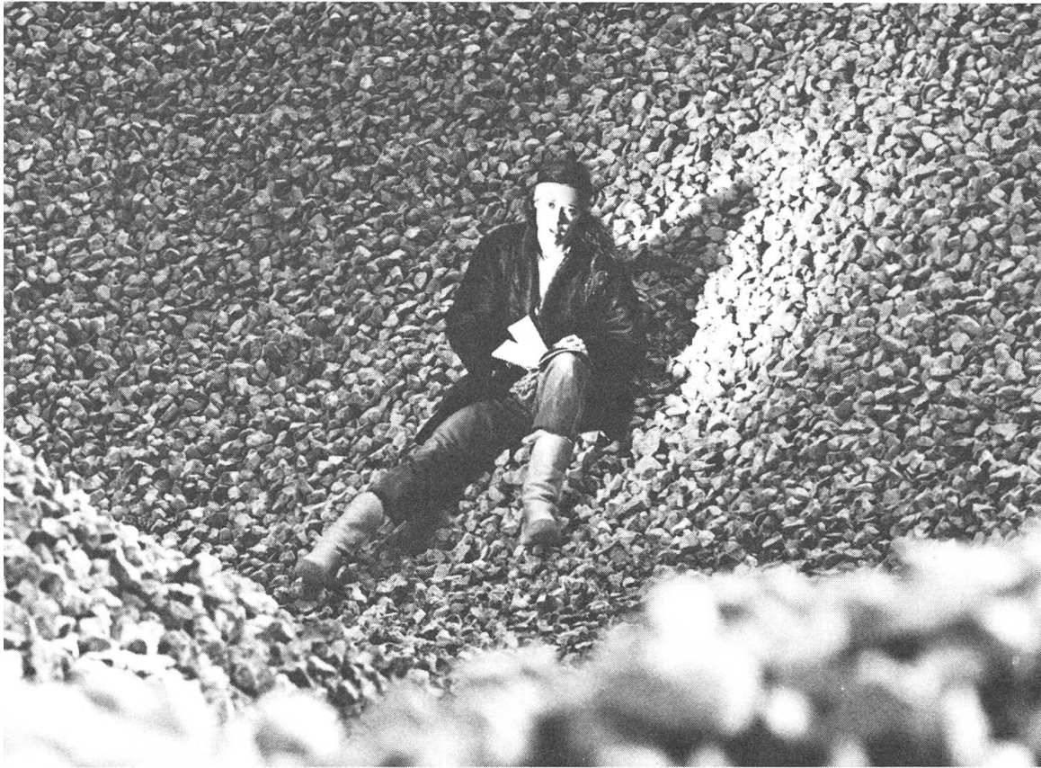
Dokumentarisches Essay «Wir und die sogenannten Normalen» von Mike Wildbolz, über acht ehemalige Psychiatrie-Patienten, die Arbeit suchen.

sozialen Ursachen tendenziell aus (z. B. «Besuch beim Hausarzt: Versteckte Depression» 17. 12. 85). Gerade weil die sozialen Bedingungen oft zu wenig analysiert werden, wird umso eher bei den Ratschlägen appellativ der Sozialtrödel von der intakten Familie, der Gemeinschaft im Dorf und von den guten alten Zeiten beschworen («Schirmbild 27. 3. 85: Gespräch über Depression).