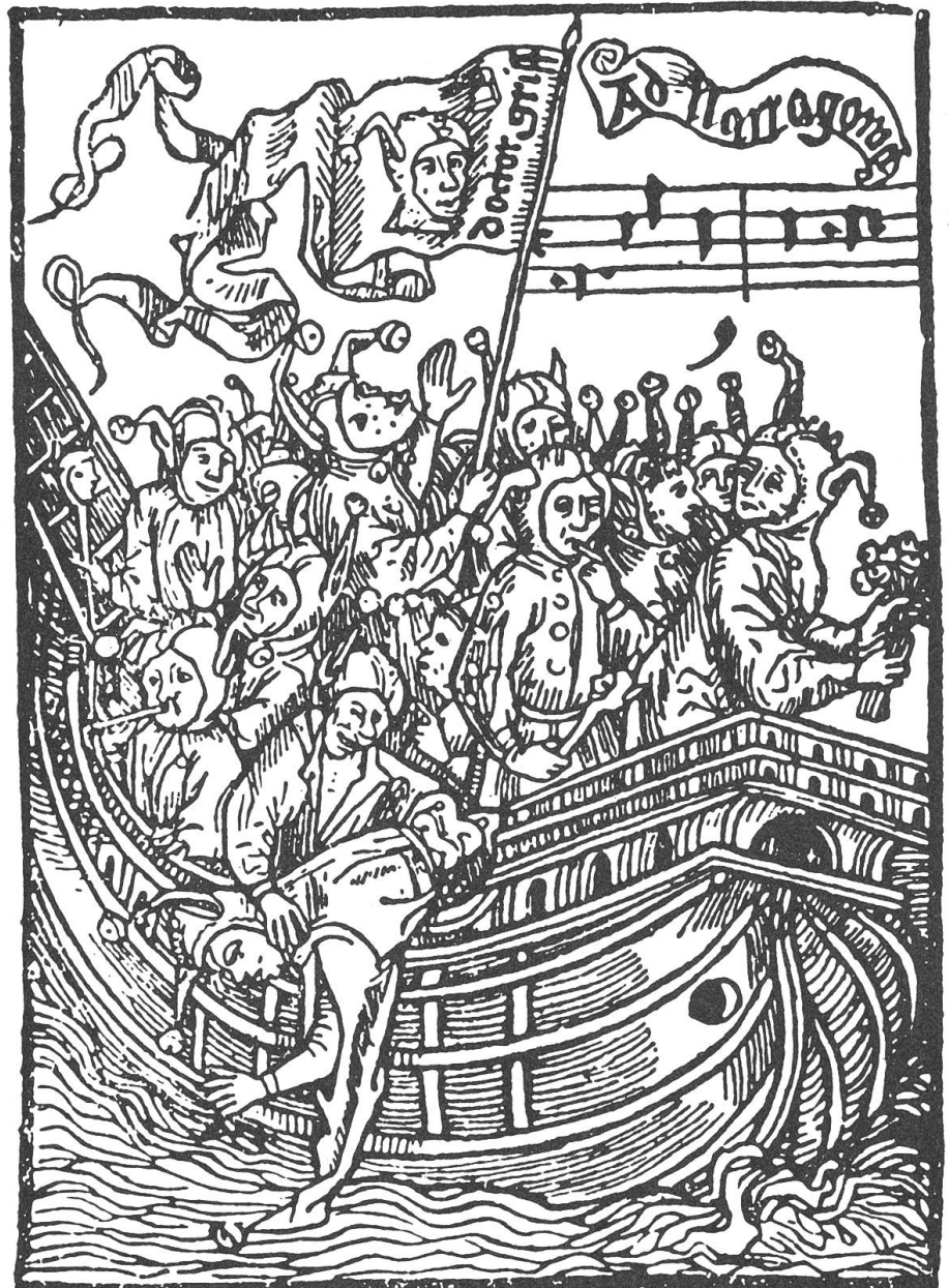
Mittelalterlicher Stich mit einem Narrenschiff. Illustration aus der fünfteiligen Fernsehserie «Im selben Boot – Der psychisch Kranke und wir» (1975) von Verena Grendi

die Tagesschau und ihr mitunter schizophreses Weltbild. Täglich werden Zuschauer mit Meldungen konfrontiert, die nicht gerade eine beruhigende Diagnose unserer Welt erlauben und politischen Einspruch wacher Bürger erwarten liessen. Doch in der Regel tut sich wenig. Zur politischen Folgenlosigkeit aber trägt die Vermittlungsform der Tagesschau selbst bei. Häufung und schnelle Abfolge von schlechten Nachrichten über Skandale und Leiden sowie die Mischung von Informationen über unterschiedliche Lebensbereiche mobilisieren zwar die Aufmerksamkeit der Zuschauer,