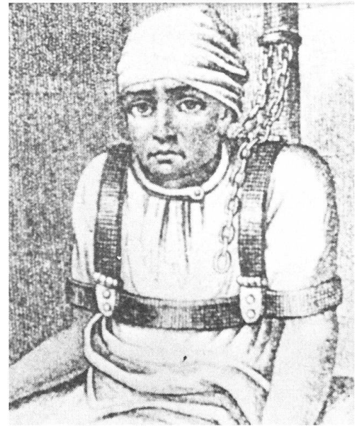
Psychiatrische Schlüsselgewalt damals und heute: Haben sich ihre Methoden nur verfeinert oder sind sie humaner geworden? Der «Mann ohne Gedächtnis», aus Kurt Gloors gleichnamigem Film, vor der Corona eines ausdifferenzierten psychosozialen Systems.

Der verschärfte Konkurrenzkampf der sich mehrenden Fernsehprogramme um die Zuschauergunst könnte allerdings schon in nächster Zukunft die Boulevardisierung auch dieses Mediums vorantreiben. Dies dürfte einer sachlichen Darstellung des psychisch Kranken nicht zum Vorteil gereichen. Die drohende Kommerzialisierung der elektronischen Medien wird schliesslich den politischen Druck erhöhen, auch beim Fernsehen Werbung ohne inhaltliche Auflagen zuzulassen. Werden einmal die Verbote aufgehoben, für Alkohol, Zigaretten oder Suchtmittel zu werben, so ergibt sich ein stossender Widerspruch zwischen einem journalistisch engagierten Programm und seiner Darstellung