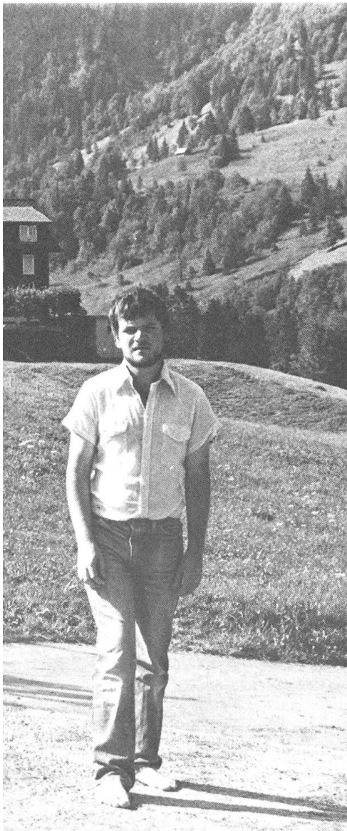
«Tonis Träume» (1985) von Paul Riniker: Der Versuch eines Fernsehdokumentaristen, der in die tiefe Weite sich verlierenden Sehnsucht des Porträtierten Widerstand zu leisten.