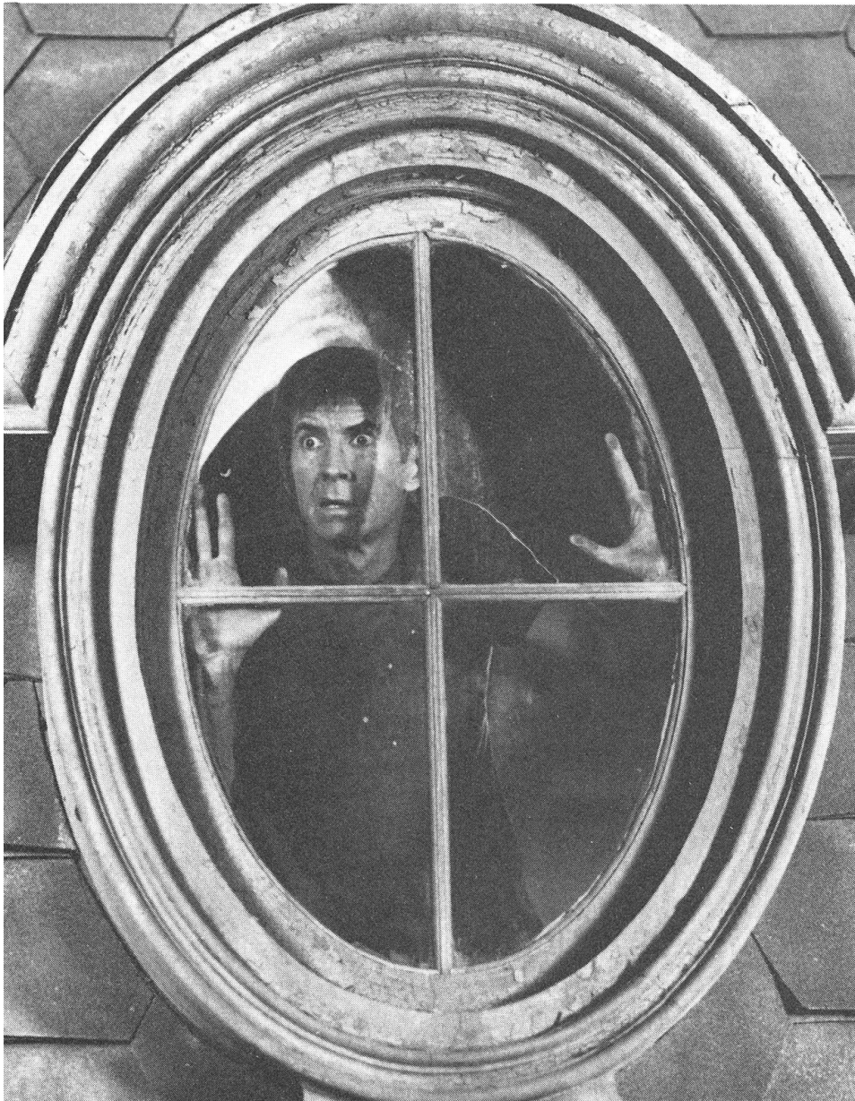
Angst als Nervenkitzel: Anthony Perkins in «Psycho 2» von Richard Franklin.

oder weniger lustlos weiterlebt und indem er den Bildern standhält. Werbung und Inszenierung der Filme kalkulieren mit dem Widerstand gegen die Darstellung. Der Genuss des Zuschauers ist einer der gewonnenen Konkurrenz, des Standhaltens; darin setzt sich das Wettbewerbsverhältnis gegenüber dem Film ähnlich wie gegenüber der Achterbahn durch. Zeugnisse von Dauerkonsumenten der Gewaltfilme belegen, dass der Inhalt dieser Produkte nicht nach Massgabe ihrer «Problematik»