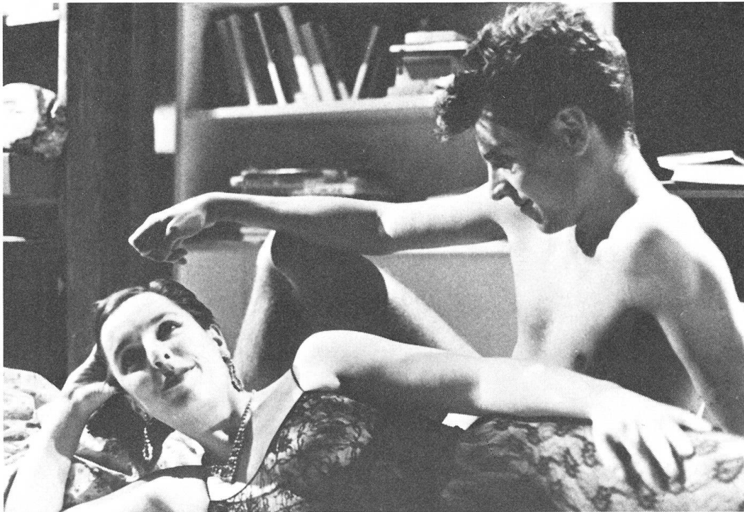
Aus «Ein Virus kennt keine Moral» von Rosa von Praunheim.

verletzungen gescheut hat, wenn es darum ging, den Emanzipationsprozess der Schwulen, ihr «Coming Out», voranzutreiben. Die schlimmste Nebenwirkung der ohnehin schon schrecklichen Krankheit sei es, dass sie als Argument gegen mühsam erkämpfte Rechte der Homosexuellen ins Feld geführt werde. Und so tritt Praunheim mit seiner AIDS-Satire gleichsam die Flucht nach vorn an, indem er alle möglichen Aspekte des längst als «Lustseuche» diffamierten Leidens ins Groteske übersteigert und vor allem jene selbsternannten Moral-Apostel der Lächerlichkeit preisgibt, die als Therapie gegen den rätselhaften Virus am liebsten jede gleichgeschlechtliche Betätigung ganz verboten sähen.