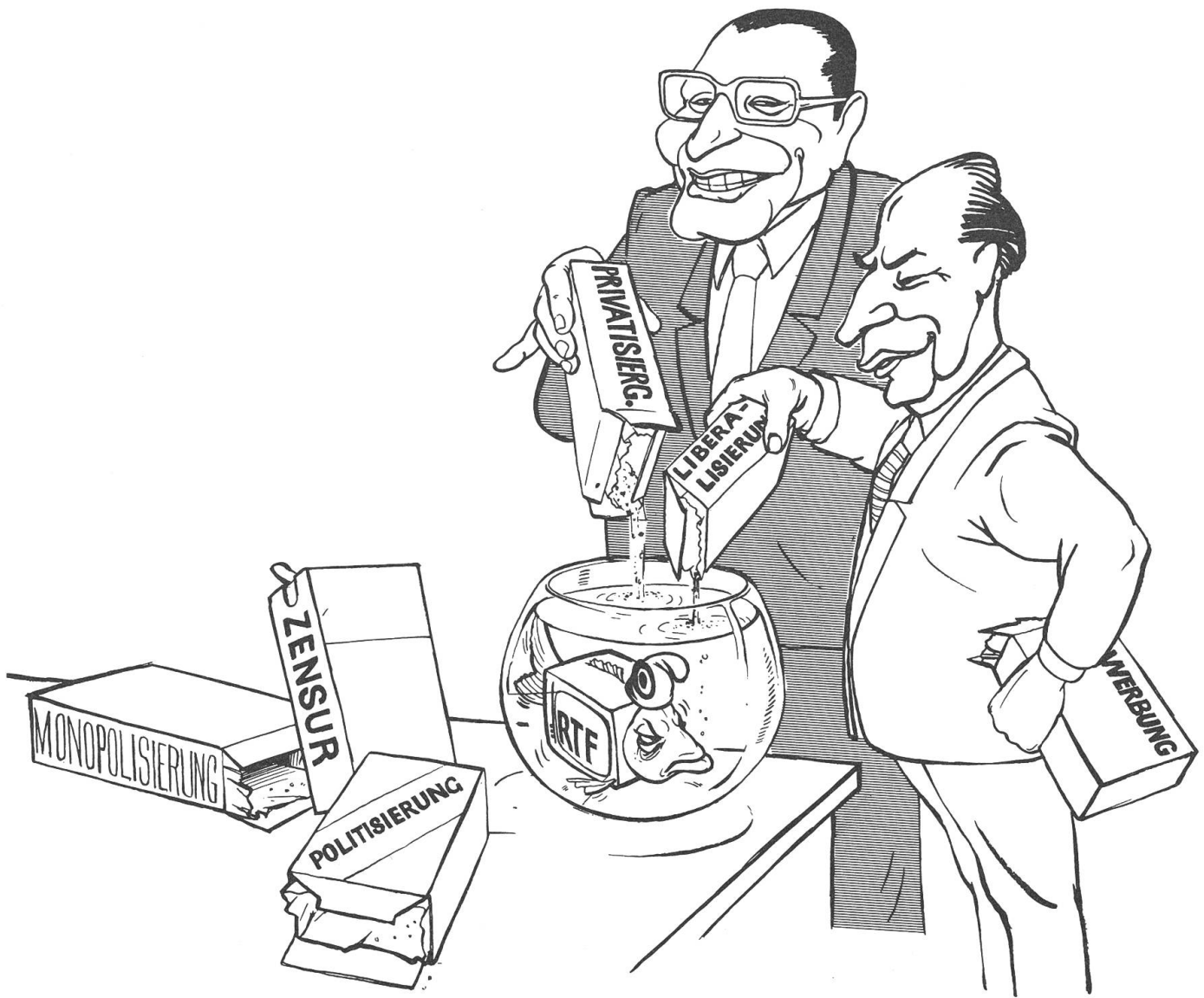
Privatisierungstendenzen beim französischen Fernsehen. Karikatur aus der «Basler Zeitung».

dingt geeignet sind; zumal diese ja zu einem wesentlichen Teil – wenn nicht gar vollständig – mit Werbung finanziert werden, was erfahrungsgemäss das Erzielen grosser Einschaltquoten erfordert. Es sei denn, die Filme erfüllten gewisse Voraussetzungen: Einem zwar ungeschriebenen, aber dennoch unantastbaren Gesetz zufolge müssen sie, wollen sie in den Massenmedien hohe Ratings erzielen und somit erfolgreich sein, von einer heterogenen Menschenmasse ohne Widerspruch konsumiert werden können. Damit dies möglich wird,