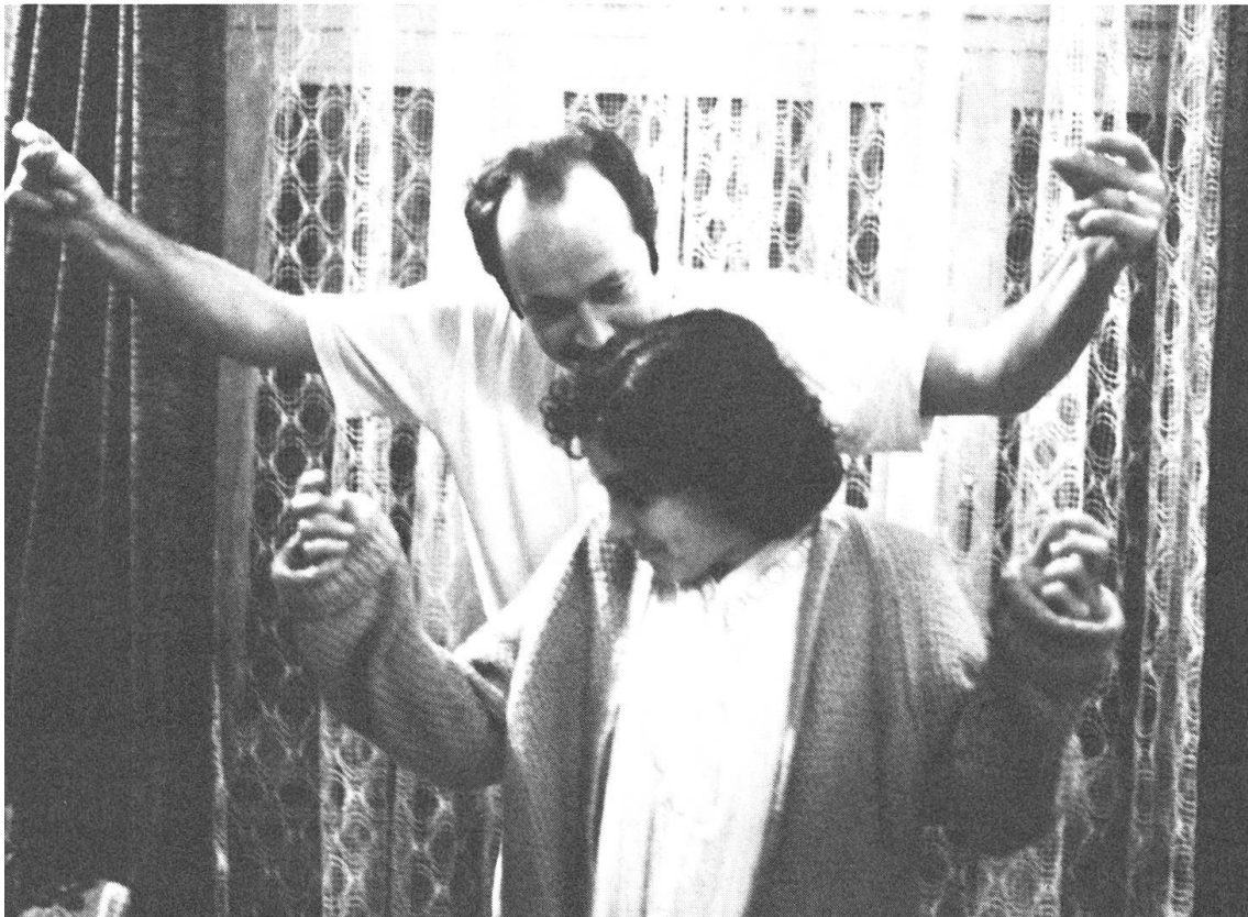
Gettosituation auf kleinstem Raum: «40 m 2 Deutschland».

urteile bestätigt. Die gibt es schon seit Jahren. Mein Film wird keine neuen schaffen. Wenn sie schreien «Ausländer raus!», dann nicht wegen meines Films.