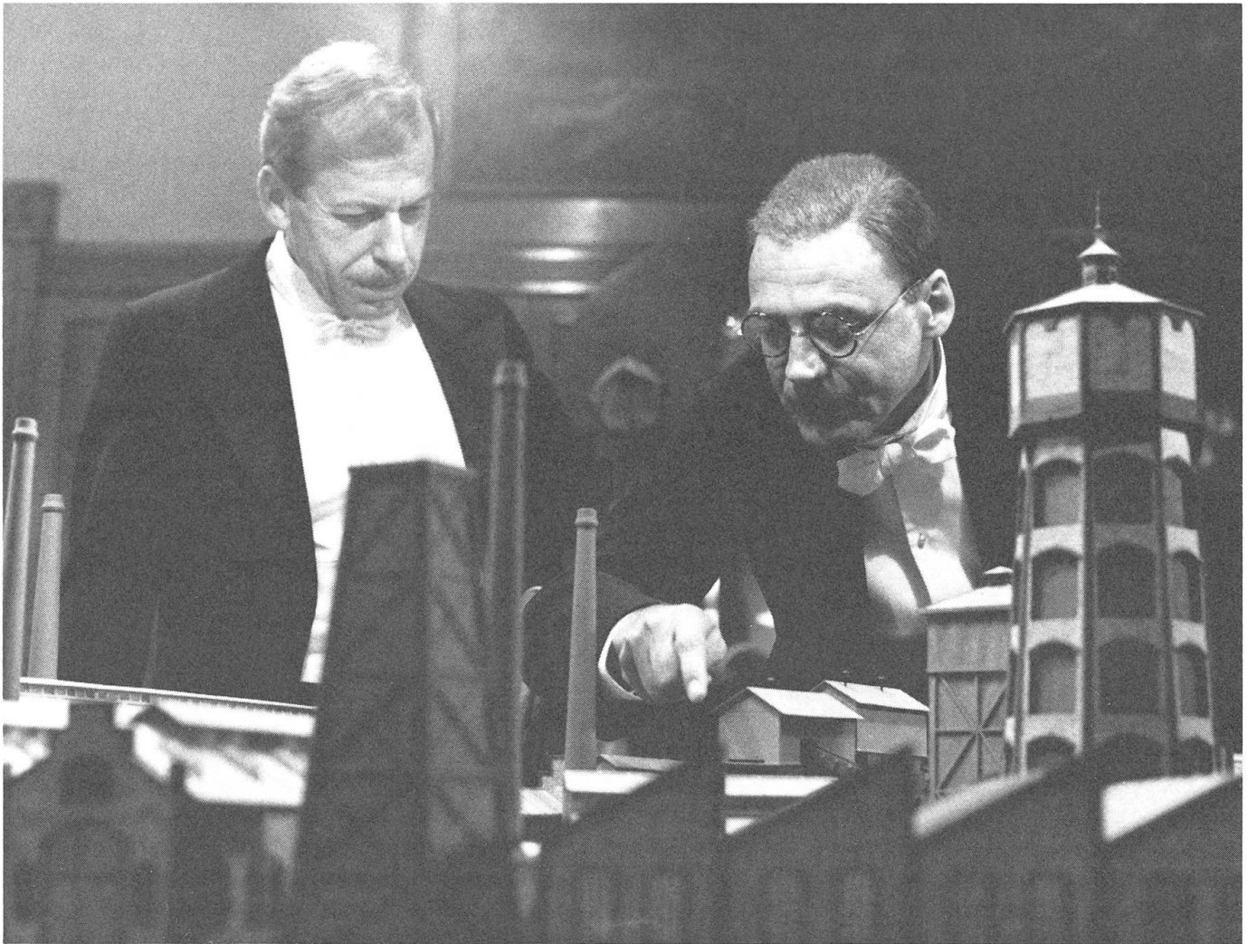
Ulrich Deutz (Rüdiger Vogler) und sein zukünftiger Schwager Heinrich Beck (Bruno Ganz) vor dem Modell der Fabrik.

aus dem goldenen Käfig grossbürgerlicher Lebensweise auszubrechen. Die berechnende Charlotte, kokainschnupfende Witwe des älteren Bruders, geht eine Vernunfthehe mit dem jüngeren Friedrich ein. Die aufmüpfige Tochter des alten Deutz Luise (Tina Engel), studiert gegen dessen Willen Medizin, heiratet den genialen Heinrich Beck und steht dem Zerrissenen bei. Elli Deutz (Katharina Thalbach), Enkelin des Patriarchen, liebt den Sohn des jüdischen Bankiers und rettet ihn vor der Gestapo. Die schöne Judith (Laura Morante), Tochter des Bankiers, bezahlt ihre Empörung gegen Tierversuche und