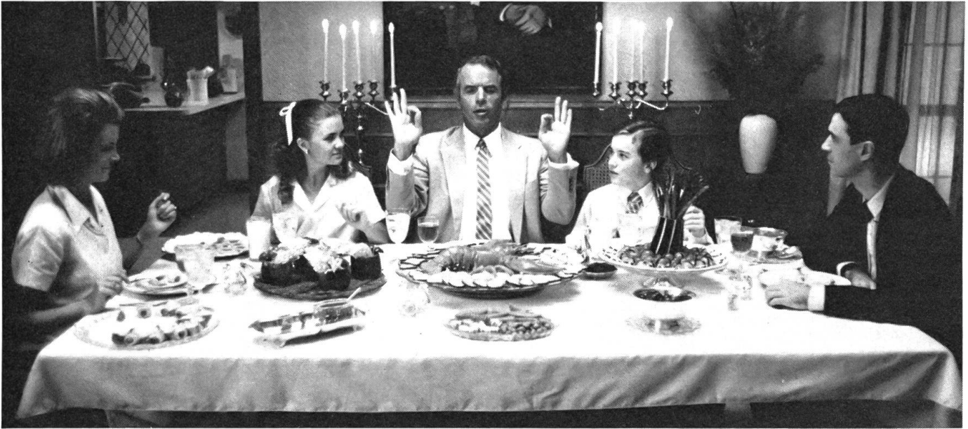
Unsere kleine Stadt, 50, 60 Jahre danach: aus «True Stories» von David Byrne.

Serienfilm. Die Autofahrten des jungen Erzähler-Cowboys sind so wunderbar gleitend und geräuschlos, als wären sie Rückprojektionen, und sein Anhalten geht detailgenau nach dem bewährten Muster, in dem die Kamera schon da ist, der Held in den Bildvordergrund hinein fährt, vielleicht noch ein kleiner Schwenk gemacht wird und dann der exakt getimte Stillstand folgt. Dann fährt die Kamera vor dem Erzähler her. Oder sie wirft zwischendurch einen formalistischen Blick von senkrecht oben auf das Geschehen; merkwürdig, doch konventionell.