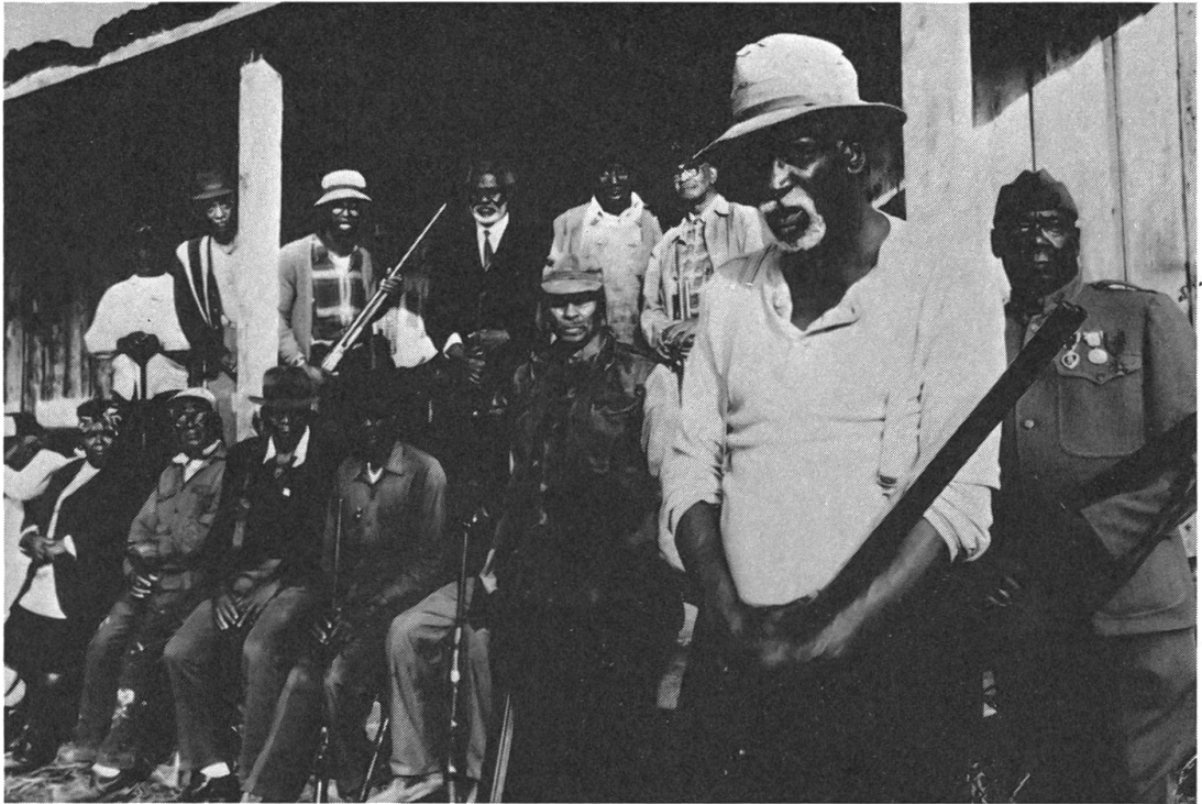
Gemeinsamer Widerstand führt zur geistigen Wiedergeburt: «A Gathering of Old Men» von Volker Schlöndorff.

Von Tag zu Tag nehmen seine Kräfte ab, das Leiden peinigt ihn bis zum Verlust der Selbstachtung, von den Angehörigen fühlt er sich mit mitleidiger Gleichgültigkeit behandelt, zum physischen Leiden gesellen sich psychische Qualen, bis er erkennt, dass Leben und Tod untrennbar zusammengehören. Der Tod erlöst ihn zum ewigen Licht, aus dem ihn die Stimme Gottes erreicht. Dass ein solch meditativer, tief religiöser Film im kommunistisch-atheistischen Russland entstehen konnte, gehört auch zu den Überraschungen des neuen sowjetischen Filmschaffens.