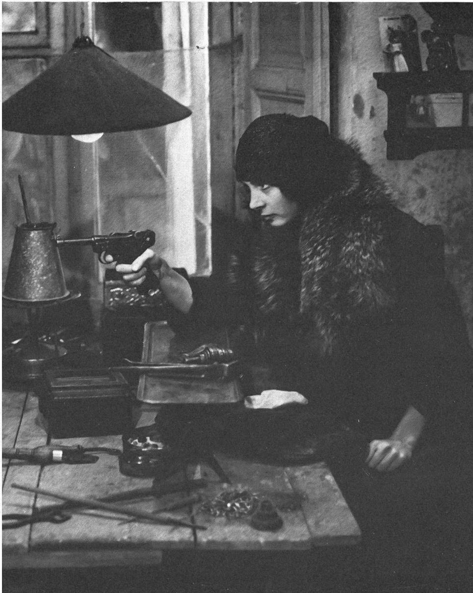
«Robinsonada ili hoj anglijskij» von Nana Dschordschadse (UdSSR) ist ein witziges Plädoyer für das Zusammenleben von Menschen unterschiedlicher Ideologien und Kulturen.

bis heute schwer getan hat. Der verstorbene Bürgermeister einer georgischen Stadt wird immer wieder aus dem Grab geholt und im Garten der Hinterbliebenen oder anderswo aufgestellt. Als Grabschänderin wird eine Frau erwischt, die mit ihrer seltsamen Aktion verhindern will, dass die Verbrechen des Potentaten vergessen werden. Vor Gericht erzählt sie ihre Lebensgeschichte, um ihre Handlung zu begründen. Die politische Brisanz von Abuladses Film ist grösser als seine künstlerische Kohärenz. Sein negativer Held, eine Stalin-Karikatur, trägt den Zwicker des Geheimdienstchefs Berija, das Schnäuzchen Hitlers und Mussolinis Parteiuniform. Diese Gleichstellung Stalins mit den faschistischen Diktatoren galt bisher nach sowjetischem Geschichtsverständnis als Sakrileg. Abuladse versteht seinen Film als einen Akt der Reue und Busse gegenüber den Opfern des Stalinismus und als Anklage gegen jene, die nichts gegen den Terror unternahmen und die Wahrheit nicht an den Tag kommen liessen. Nicht zu übersehen ist die christliche Symbolik, mit der betont wird, dass am Anfang des unmenschlichen Terros der Verlust des Gewissens lag. Am Schluss des Films sagt eine alte Frau, deren Frage, ob diese Strasse zur Kirche führe, negativ beantwortet wird: «Wozu hat man diese Strasse denn gebaut, wenn sie nicht zur Kirche führt?»