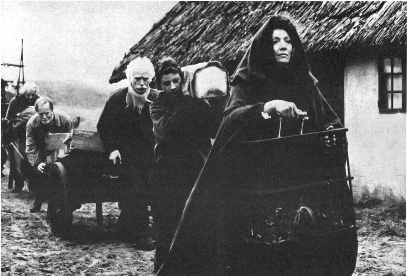
Stéphane Audran in «Babettes Gaestebud» von Gabriel Axel.

Kommune aus Frankreich fliehen. 14 Jahre lang dient sie den Schwestern als Köchin und Magd. Eines Tages erhält sie von der Post einen Check über 10000 Goldfranken, die sie in der französischen Lotterie gewonnen hat. Babette bittet die Schwestern um die Erlaubnis, ein Festmahl für sie und die Gemeindemitglieder herrichten zu dürfen, um den Gewinn zu feiern. Widerstrebend willigen die Schwestern zu dieser sonst verpönten irdischen Lustbarkeit ein. Babette lässt exquisite Speisen und Getränke kommen, das Beste vom Besten, und bereitet ein Festmahl nach den Regeln der höchsten französischen Kochkunst zu, wie man es köstlicher in diesen nördlichen Breiten noch nie zu sehen