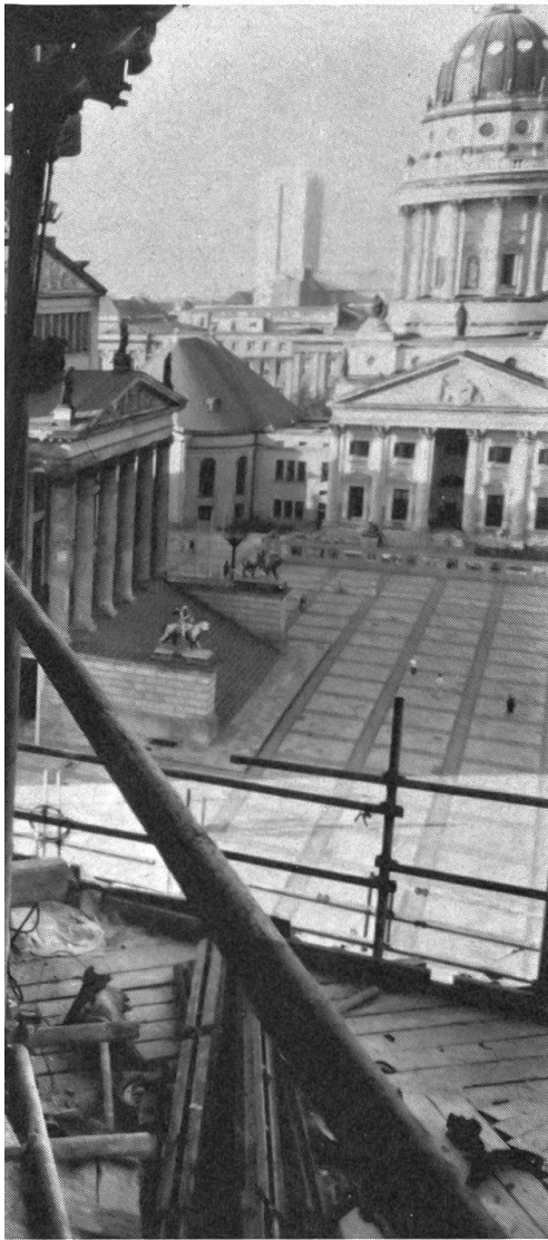
Helga Reidemeisters Dokumentarfilm «Drehort Berlin» wirft einen subjektiven Blick auf die Menschen in der geteilten Stadt und spürt Erinnerung, Alltagserfahrung und Träumen nach.

sen, aber wenn dem Zuschauer leere anstelle stimmungsvoller Bilder und Klischees anstatt überzeugender Charaktere angeboten werden, dann kann – wie hier – aus einem Psycho-Krimi ein Langweiler werden.