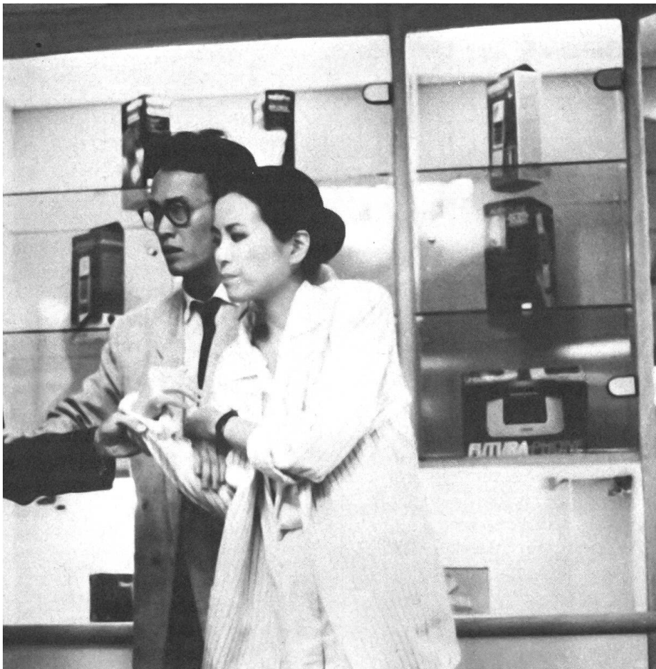
«Konbu finze» (Die Terroristen) von Edward Yang ist eine aufschlussreiche Auseinandersetzung mit Taiwans gesellschaftlichen Veränderungen.

Für mich steht ausser Zweifel, dass die beiden Filme aus Taiwan und Hongkong die besten des Wettbewerbs waren, selbst wenn auch sie das Niveau des Durchschnittlichen kaum übertrugen. Dem Festivalkonzept – es initiiert die Suche nach neuen Autoren und neuen Filmländern – entsprachen sie überdies so wenig wie die argentin-