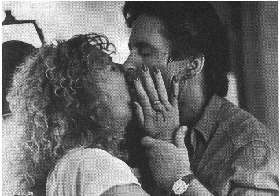
Fatale Leidenschaft: Alex (Glenn Close) und Dan (Michael Douglas).

Vom genüsslichen Biss ins Rahmtörtchen, in das der Anwalt Dan während des Geschäftsmeetings seine Nase hineinstippt, bis zum vergeblichen Warten auf ein Taxi im strömenden Regen: Alex spannt ihren Schirm auf, seiner klemmt, und er wirft ihn weg. Sie flüchten gemeinsam in ein Restaurant. Alex ist von ihm hingerissen, sie will ihn. Dan ist von der souveränen «Gorgone» fasziniert. Harter Schnitt in die Behausung, dem Loft, von Alex: Wild stürzen sie sich in eine Love-Affaire. Diesmal geschieht der «Spontanfick» (Erica Jong) nicht auf dem Küchentisch wie in «The Postman Rings Twice», sondern auf dem Spülstein: grotesk, spassig – entschärft – Lachen im Publikum. Zur Kühlung der hitzigen Umklammerung öffnet sie den Wasser-