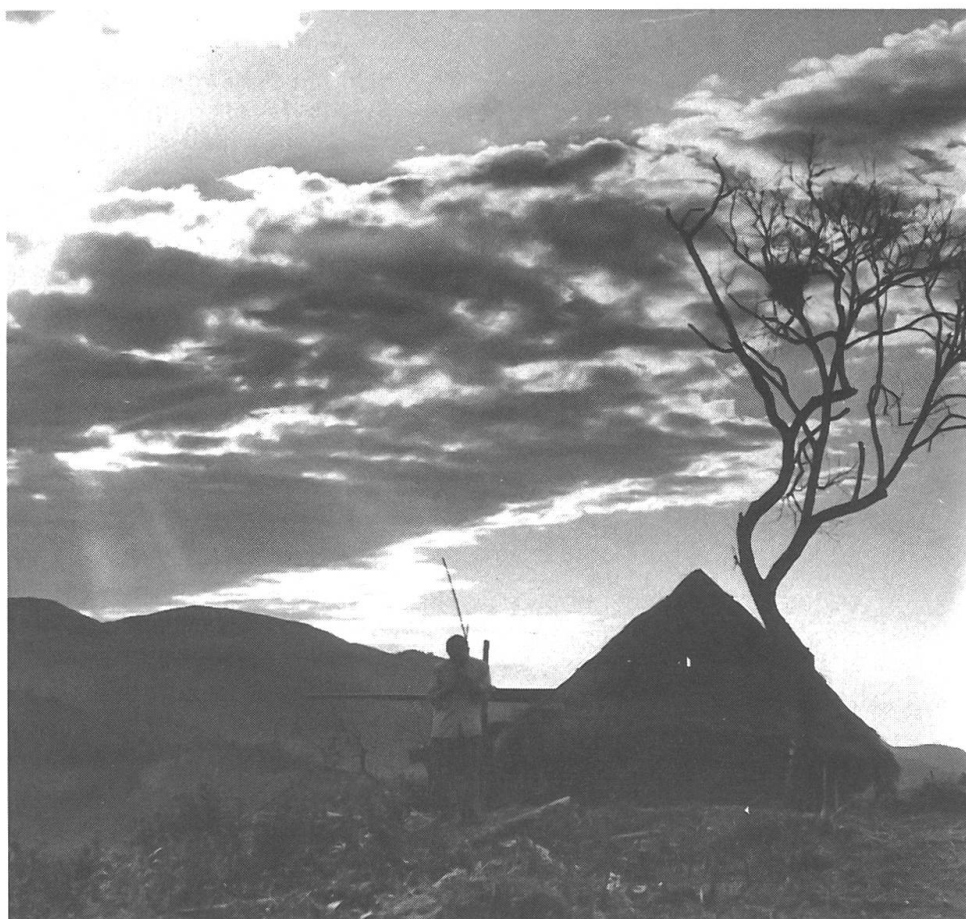
In China heissen die Lehrer «König der Kinder»: aus « Hai Zi Wang » ( Der König der Kinder ) von Chen Kaige.

«Bohnenstange» auf die unbeholfene Anwendung des offiziellen Lehrbuches, bis einer der Schüler, der ehrgeizige Wang-fu, rebelliert und ihm das Fehlen jeder pädagogischen Fähigkeit vorwirft. Darauf ändert der Lehrer seine Unterrichtsmethode und versucht den Schülern Kreativität, Phantasie und Eigeninitiative beizubringen, wobei sich jedoch die traditionellen Gewohnheiten als fast unüberwindlich erweisen. Der begabte Wang-fu interessiert sich nur für die quantitative Erweiterung seines Wissens: Er kopiert Seite um Seite die Zeichen eines Wörterbuches und hofft, später immer grössere Wörterbücher abschreiben zu können. Als nicht-konform mit der Parteidoktrin wird der Lehrer schliesslich von einem Funktionär seines Postens enthoben und wieder zur Feldarbeit geschickt. Er fügt sich ohne Protest und Bitterkeit – ein jugendlich gebliebener Mensch, der sich den op-