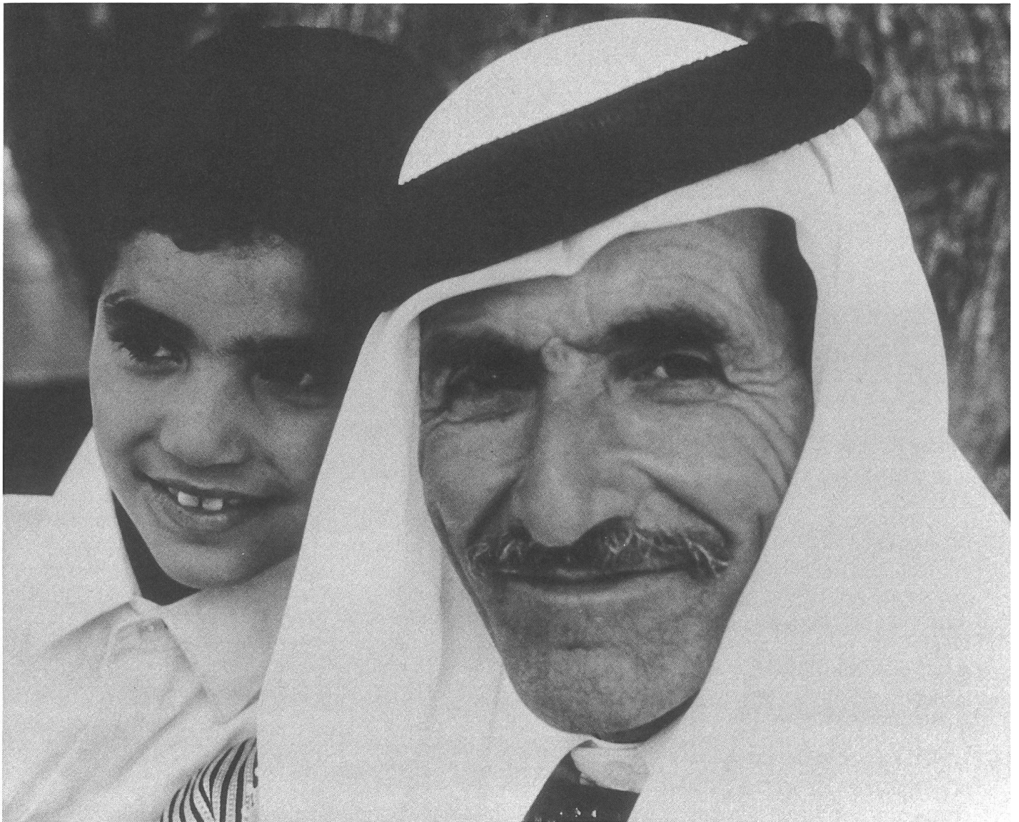
Zärtlich, ruhig und distanziert: «Noce en Galilée» von Michel Khleifi.

Belange, die ein breites internationales Publikum interessieren dürften. Wer jedoch eine saftige Polit-Parabel oder gar ein Melodram à la Costa-Gavras erwartet hat, wird positiv enttäuscht. Dieser Film – ein französischer Kritiker nannte ihn «un des tout premiers films palestiniens de l'intérieur» – lässt, was handfester Konfliktstoff schien, aufgehen in einem Kaleidoskop vielschichtiger Brechungen.