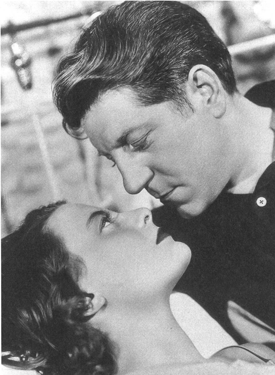
«Klassisches» Liebespaar des französischen Films: Jean Gabin und Michèle Morgan.

Jahre arbeitet Carné nebenbei auch als Filmjournalist und wird durch den amerikanischen Gangster-Film und den deutschen expressionistischen Film (Friedrich W. Murnau, Fritz Lang) nachhaltig beeinflusst. Von Murnau übernahm Carné die Forderung: «Die Kamera ist eine Person der Handlung.»