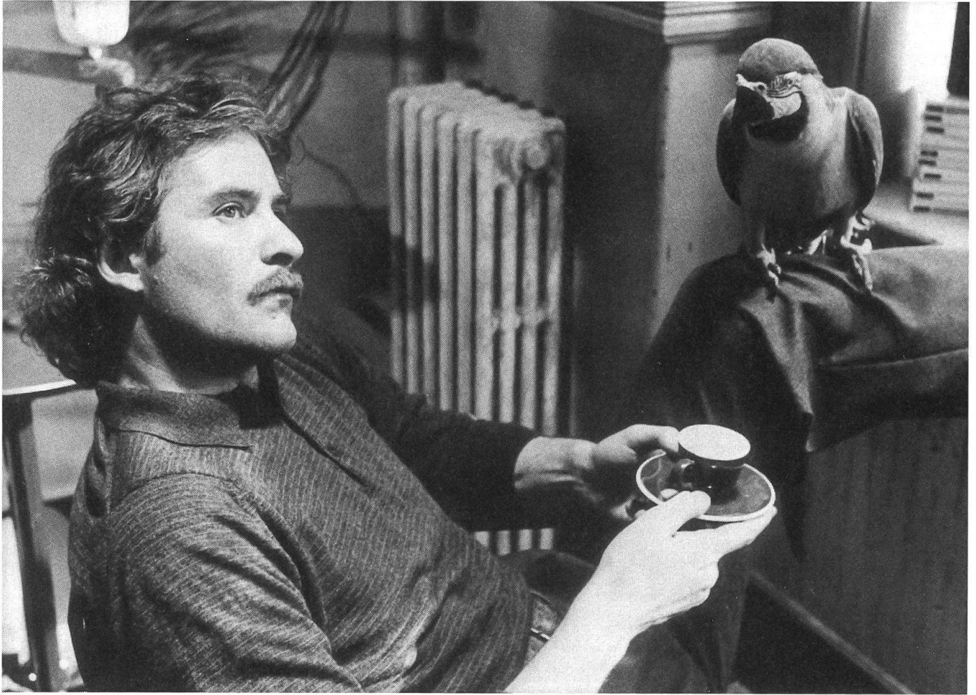
Arbeitet mit Charme und unkonventionellen Methoden: Kevin Kline als Nick.

Das Motiv: Ein Racheakt, Geld, eine krankhafte Veranlagung – ein Grund für die Greuelthat ist Voraussetzung dafür, dass diese überhaupt geschehen kann. In «The January Man» versteckt sich das Motiv, genau wie Täter und Opfer, in nicht existierenden Bildern. Was sich bei näherer Betrachtung gar einer Logik erschliesst – denn ein Motiv würde aus Täter und Opfer Personen, wenn nicht gar Persönlichkeiten machen – ist genau das, was dieser Film nicht zulässt.