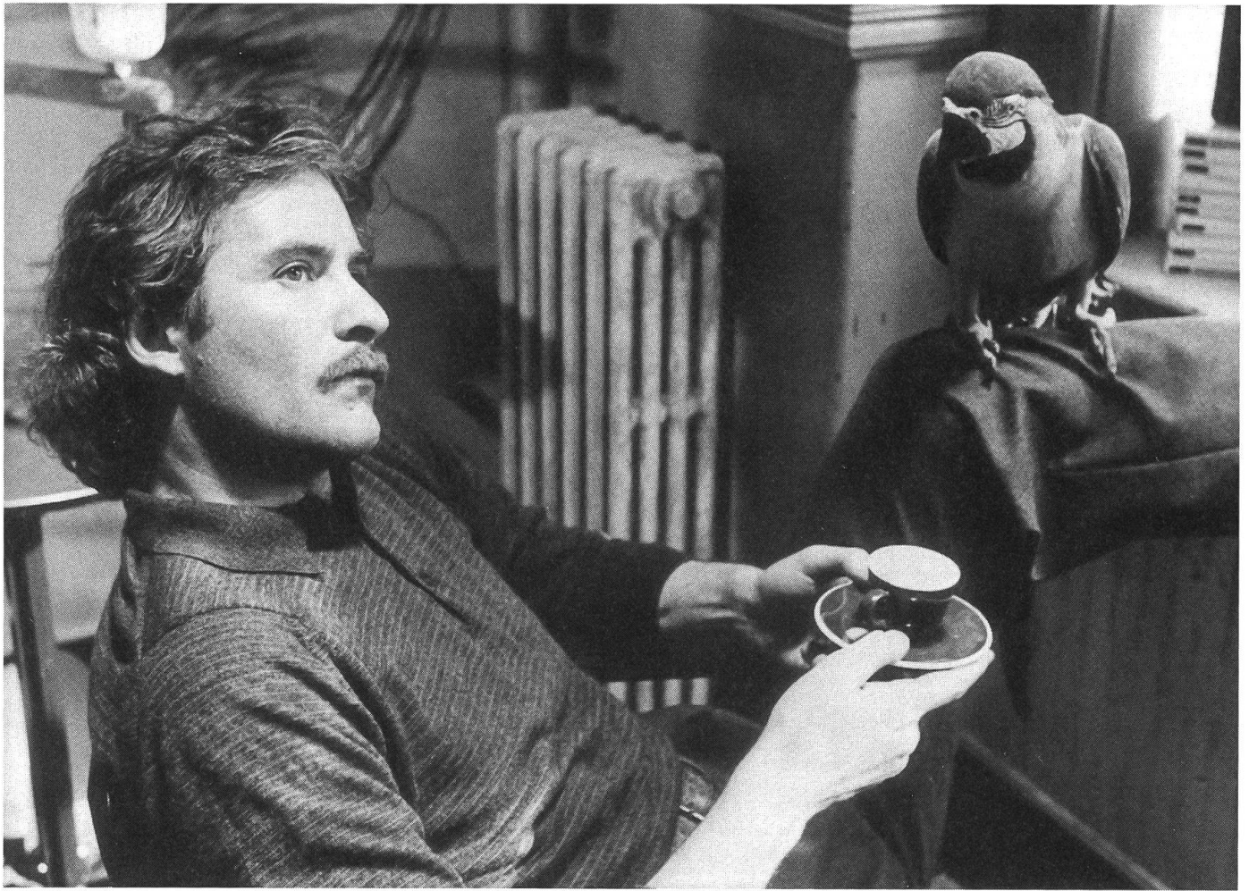
Arbeitet mit Charme und unkonventionellen Methoden: Kevin Kline als Nick.

Das Motiv: Ein Racheakt, Geld, eine krankhafte Veranlagung – ein Grund für die Greuelthat ist Voraussetzung dafür, dass diese überhaupt geschehen kann. In «The January Man» versteckt sich das Motiv, genau wie Täter und Opfer, in nicht existierenden Bildern. Was sich bei näherer Betrachtung gar einer Logik erschliesst – denn ein Motiv würde aus Täter und Opfer Personen, wenn nicht gar Persönlichkeiten machen – ist genau das, was dieser Film nicht zulässt.