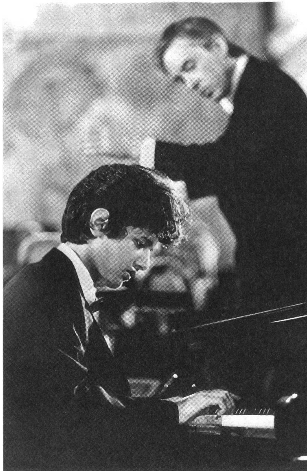
Madame Sousatzka kann den ersten triumphalen Auftritt ihres talentierten Schülers nicht verhindern: Shirley MacLaine und Navin Chowdhry.

als Manek ihr seine Konzertpläne gesteht: Sie erkennt mit Schrecken, dass Manek seine Karriere allmählich selbständig, ohne ihre Anleitung, vorantreiben wird. Dem natürlichen Ablösungsprozess eines jeden Schülers von seinem Meister möchte sich Madame aber starrköpfig widersetzen. Im psychischen Kampf, den sie mit dem Jungen ficht, prallen ihr Egoismus und das Interesse, das die Öffentlichkeit an einem solch begnadeten Künstler wie Manek hat, hart aufeinander. Beiläufig wirft Schlesingers Film in diesem Zusammenhang auch die Frage auf, inwieweit ein Künstler sein Talent verschenkt, wenn er öffentlich auftritt, nur um Geld zu verdienen.