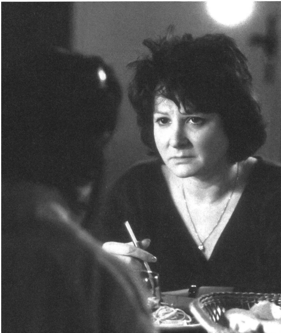
Das Klischee üblicher Dreiecksgeschichten auf den Kopf gestellt: Gérard Depardieu, Carole Bouquet (mit Rücken zur Kamera), Josiane Balasko.

zur Zeit mit Erfolg ihre Komödie «L'ex-femme de ma vie») spielt die Figur der Colette mit einer Mischung von Naivität, Natürlichkeit und Burschikosität. Sie liebt an Bernard seine «Garagistenhände», sagt sie einmal. Ähnlich wie ihr Geliebter erlebt sie den «Coup de foudre» natürlich wie ein Gewitter, doch ist sie dem Ansturm der Gefühle weniger hilflos ausgeliefert als ihr Partner.