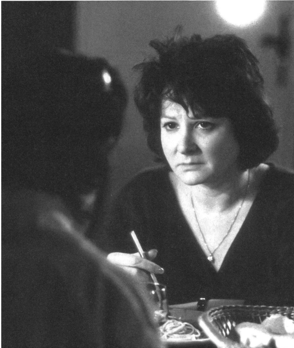
Das Klischee üblicher Dreiecksgeschichten auf den Kopf gestellt: Gérard Depardieu, Carole Bouquet (mit Rücken zur Kamera), Josiane Balasko.

zur Zeit mit Erfolg ihre Komödie «L'ex-femme de ma vie») spielt die Figur der Colette mit einer Mischung von Naivität, Natürlichkeit und Burschikosität. Sie liebt an Bernard seine «Garagistenhände», sagt sie einmal. Ähnlich wie ihr Geliebter erlebt sie den «Coup de foudre» natürlich wie ein Gewitter, doch ist sie dem Ansturm der Gefühle weniger hilflos ausgeliefert als ihr Partner.