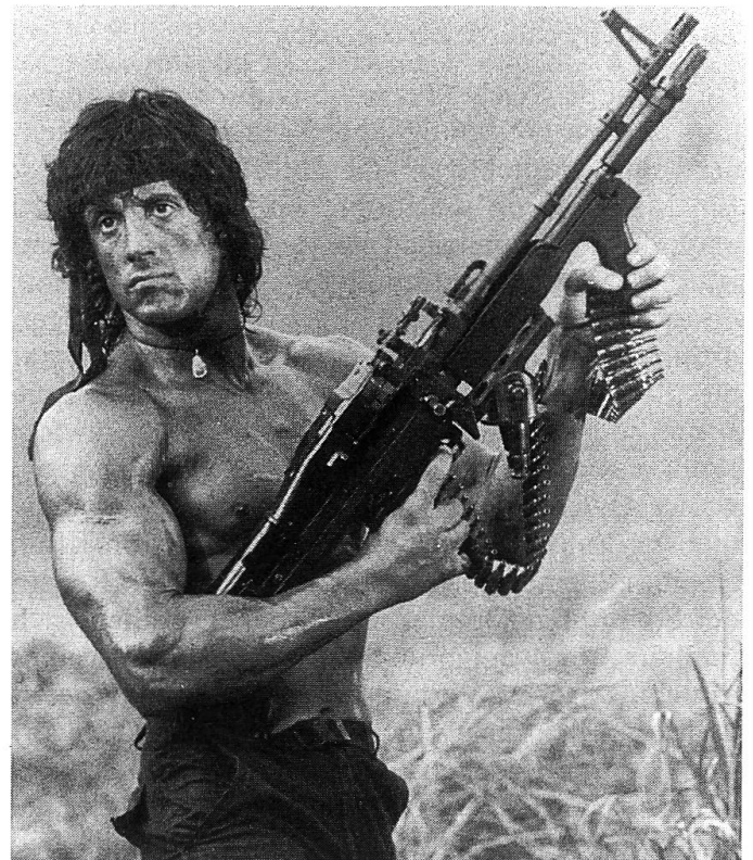
Krach, Kampf und Krieg: Mann und Frau im Welt- bild des Russ Meyer (aus «Motor-Psycho», 1965).