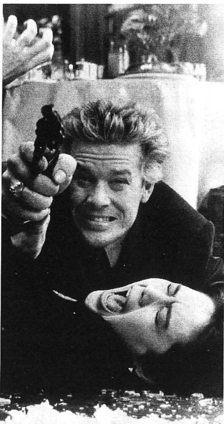
Die Frau stellt sich dem Cop plötzlich selbstbewusst in den Weg («The Year of the Dragon»).

Der einsame Wolf, mit dem tumben Profil eines klassischen Helden, der sein Recht gewalttätig durchsetzte, bekam ein zweites Gesicht und die Züge einer moralisch gebrochenen Kreatur, die die korrupten Praktiken seiner Kollegen stillschweigend hinnahm und plötzlich mit