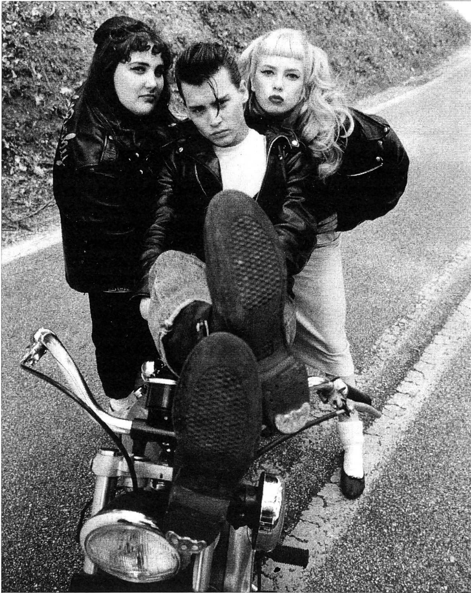
Stolze Mitglieder der «Drapes»: Ricki Lake, Johnny Depp, Traci Lords.

Musik und den Tanz als Körpersprache hinzu, so hat man die Spielfiguren für das zusammen, was sich als Mythologie des Teenage bezeichnen lässt. Diese Mythologie hält spezifisch jugendliche Identifikationsmuster bereit und konstituiert so die Jugendlichen recht eigentlich als soziale Gruppe. Der Jugendliche – so das Zentralmythologem – ist die fleischgewordene Rebellion; man(n) ist «bad», kann keine Satisfaktion kriegen – grundsätzlich nicht – und muss als Easy Rider in Permanenz das Leben provozieren. Das wichtigste für all diese Rebellen ohne Grund ist die Spontaneität, die Fähigkeit, allein aus einer Situation heraus und ohne Vorgabe von