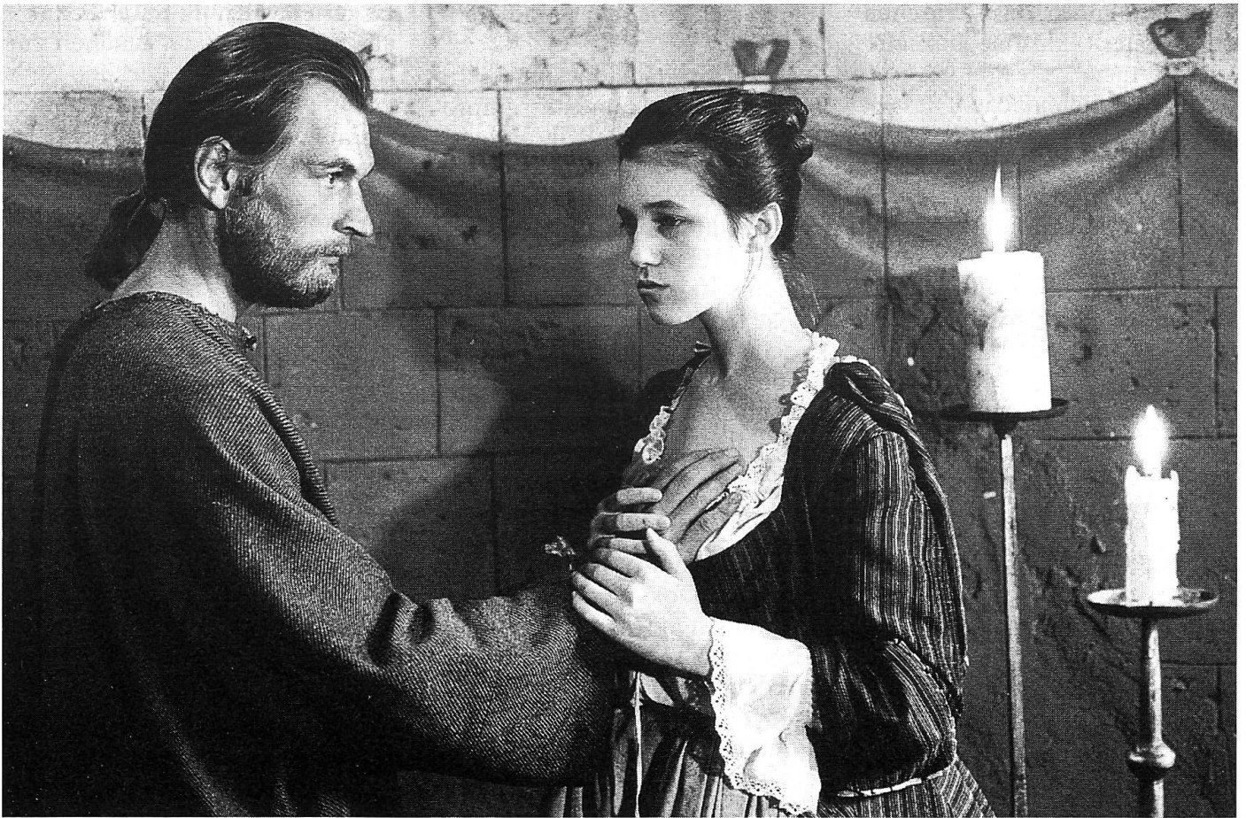
Der Eremit und das Mädchen: Julian Sands und Charlotte Gainsbourg.

lige herbei, die mit ihren Freunden gewettet hat, dass es ihr gelingen werde, den bekannten Eremiten zu verführen. Fast wäre es ihr gelungen, hätte Sergio sich nicht im letzten Moment einen Finger abgehackt, um seinen Körper zu züchtigen. Den Versuchungen der Eitelkeit jedoch kann er nicht widerstehen: ein Brigant bringt seinen stummen, kranken Sohn herbei, Sergio lässt sich überreden, ihm die Hand aufzulegen. Kurz darauf gibt der Junge zum ersten Mal einen Ton von sich – er imitiert das Blöken eines Schafes. Sergio ist ein Wunderheiler. Pilger strömen herbei. Die Kirche lässt seine Einsiedelei ausschmücken. Kreuze werden vor dem Häuschen aufgestellt. Ein Kaufmann bringt seine adoleszente Tochter zur Heilung vorbei. Allein mit