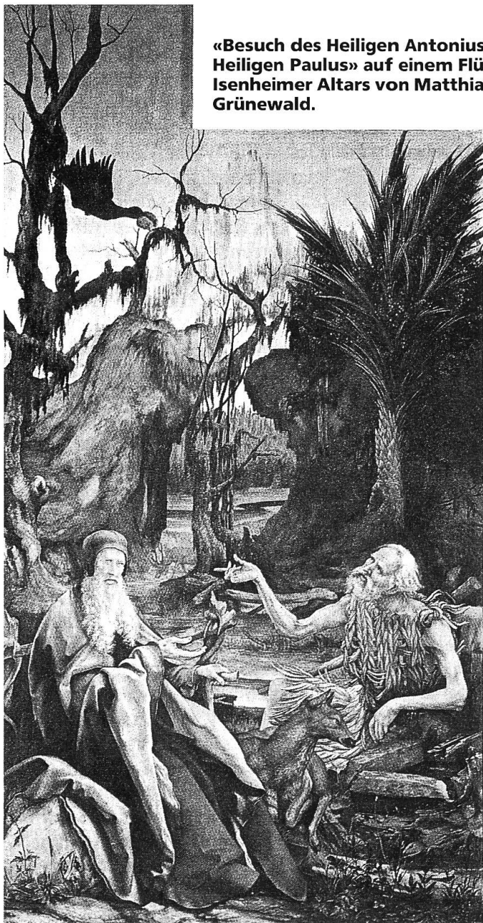
«Besuch des Heiligen Antonius beim Heiligen Paulus» auf einem Flügel des Isenheimer Altars von Matthias Grünewald.

Das Gespräch mit Paulus endlich lenkt ihn, der immer die «ganze Wahrheit» in seinen Besitz bringen will, zur Einsicht, dass keines Menschen Weg zum Frieden seines Herzens dem Weg eines anderen gleicht. Dass man über Gott zwar reden kann, ihm indessen näher kommt, wenn man in sein Schweigen eintaucht. Dass der eine in der Stille verweilen kann, der andere aber, redend, lehrend, tröstend zu jenen hingehen muss, die seiner bedürfen. Die Wüste mag, so die Lehre, für den einen der Raum der Dauer sein; für den anderen ist sie das Stück Zeit, die ihn reif macht, das Dienen an den Menschen in Demut auf sich zu nehmen.