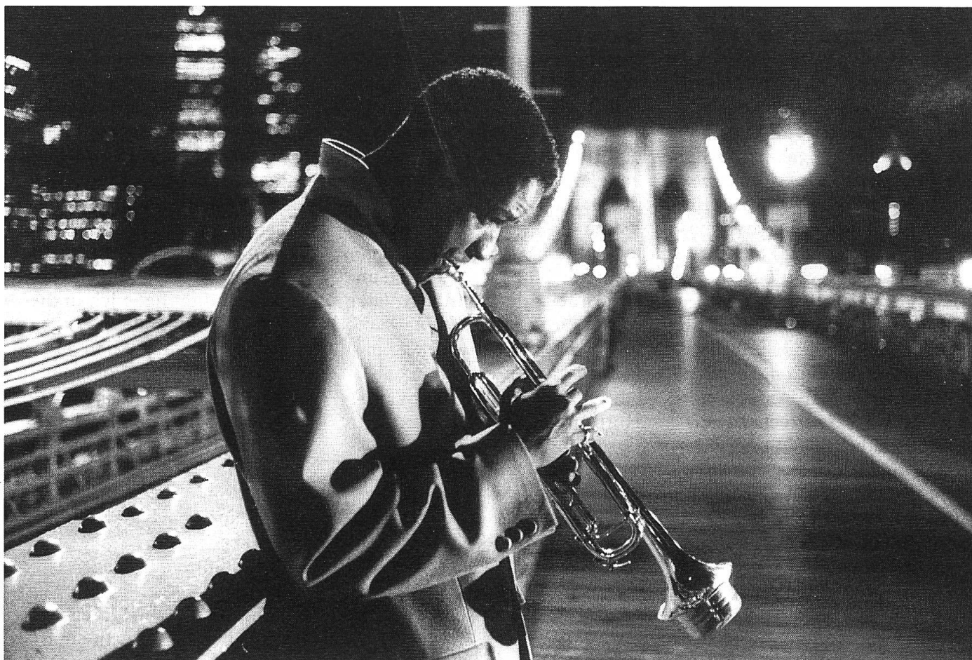
Des Jazzers wichtigste Liebe: seine Trompete.

Pictures stellte dem ehemals unabhängig arbeitenden Low-Budget-Filmemacher diesmal zehn Millionen Dollar zur Verfügung. Nicht zufällig, spielte doch «Do the Right Thing» (ZOOM 14/89) bei 6,5 Millionen Kosten immerhin 28 Millionen ein.