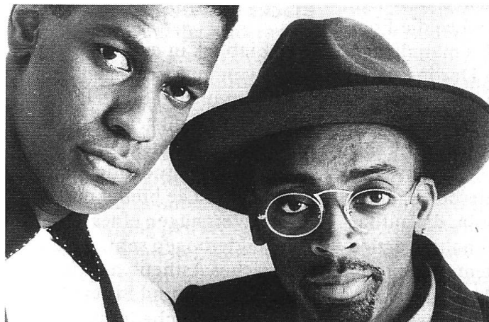
Unfähiger Manager (Spike Lee, rechts) mit Bandleader (Denzel Washington).

Bandleader des Quintetts ist der Trompeter Bleek Gilliam, eine eigentliche Gegenfigur zu den Protagonisten der zwei Jaz-