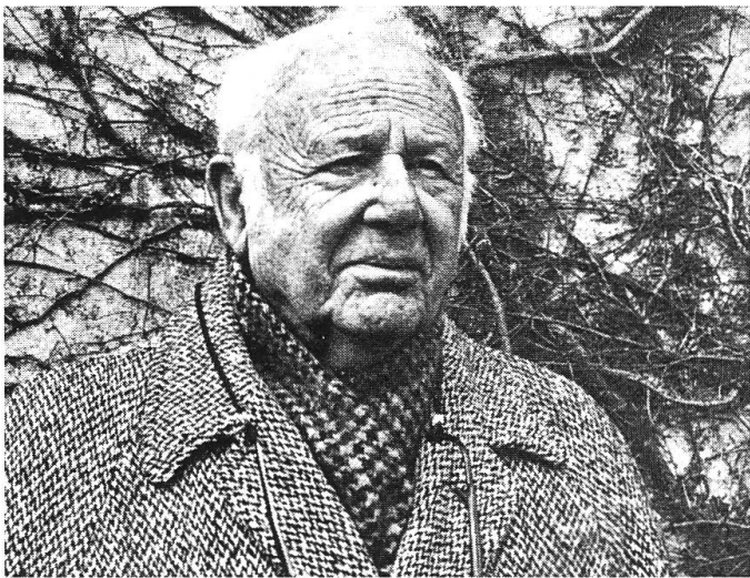
Fotografien von Paul Strand, er selber oben links.

Strand wurde radikaler, brachte sein Können auch in die