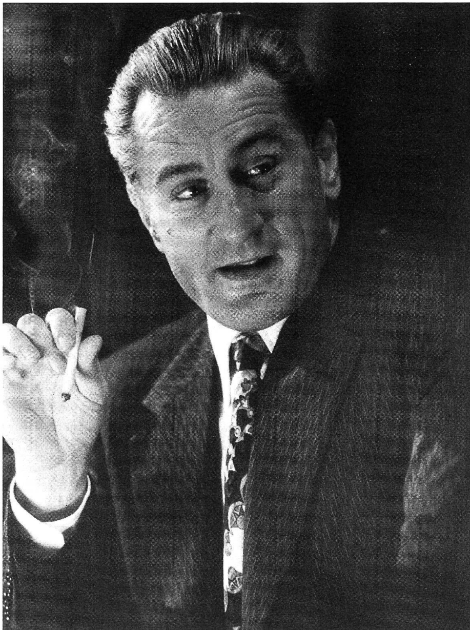
Wer in Little Italy geboren wurde, lernt entweder Priester oder Gangster. Jimmy Conway (Robert De Niro) hat sich auf letzteres spezialisiert.