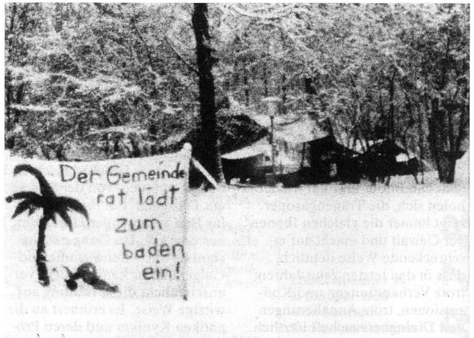
Die Stürmung des Hüttendorfes Zaffaraya im November 1987 (Bild oben), markierte für manche Berner Bewegte den Höhepunkt der staatlich verordneten Eiszeit.

lanzierung von Siegen und Niederlagen noch eine verklärende Denkmalsetzung. Andreas Berger und sein Cutter Christoph Schertenleib sahen sich mit einer immensen Materialfülle (15 Stunden Bild- und 12 Stunden Tonmaterial) konfrontiert. Der Schneidetisch wurde – nach Jahren der Anhäufung von Bild- und Tonmaterialien – zur eigentlichen Geburtsstätte des knapp zweistündigen, auf 16mm aufgeblasenen Dokumentarfilms. Die Reduktion auf das Wesentliche