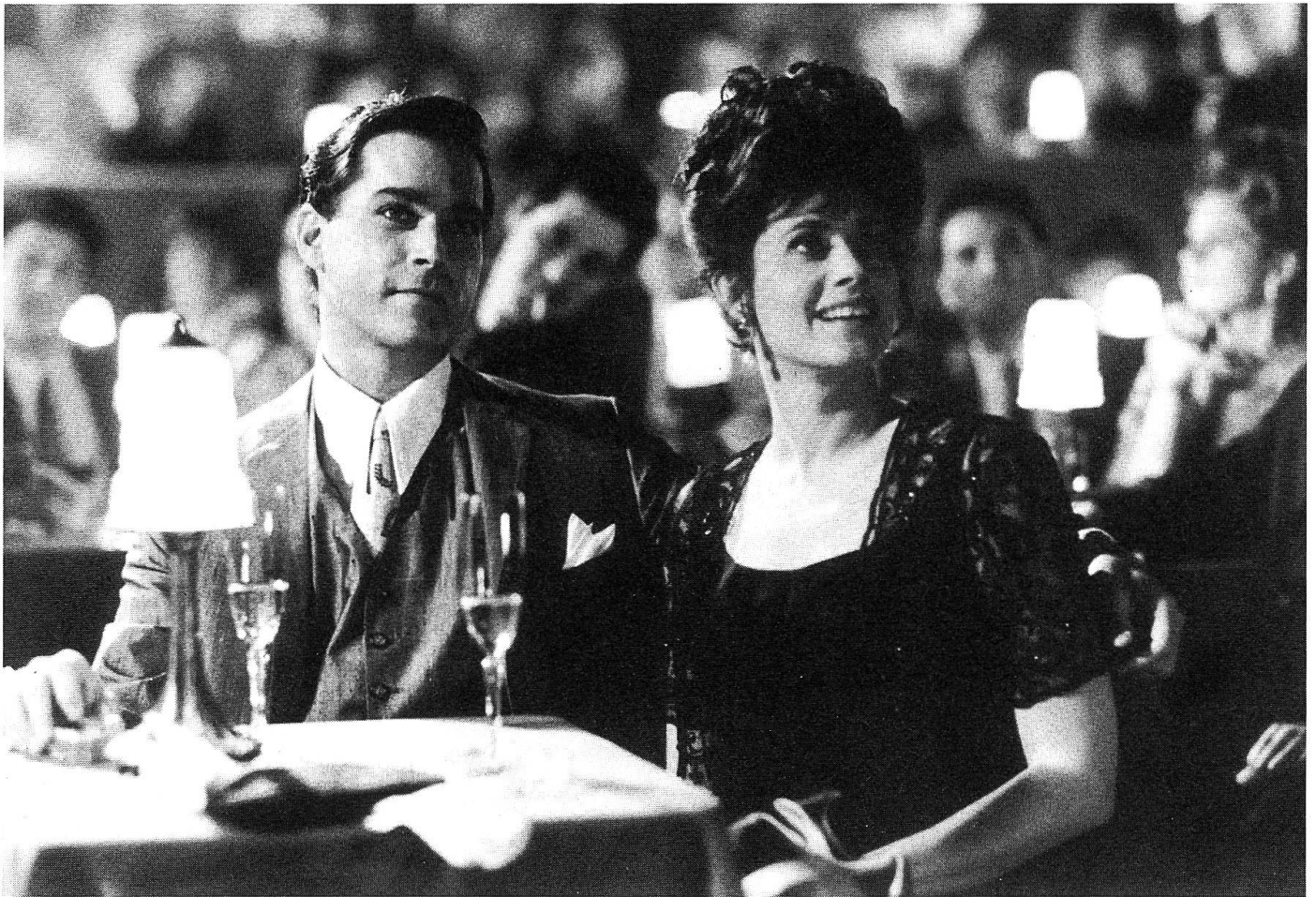
Noch Absolvierung seiner «Lehrjahre» heiratet Henry Hill (Ray Liotta) die Jüdin Karen (Lorraine Brocco).

schaft geachtet werden, und nie und unter keinen Umständen dürfen die Regeln gebrochen werden. Und diese Regeln dienen einzig und allein dem einen Zweck, dass möglichst viel Geld auf legale und illegale Weise in die Taschen der richtigen Leute fließt. Und vor allem: Geld ist nie schmutzig.