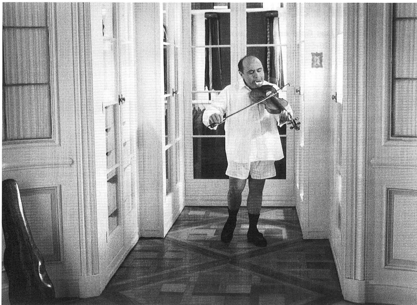
Kotzbrocken Garfield probt Charmeoffensive.