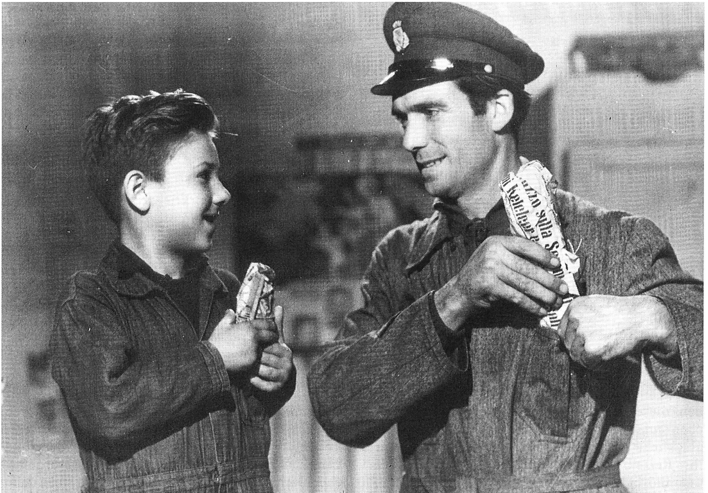
Verknüpft Alltäglichkeiten überzeugend mit Aktuellem: «Ladri di biciclette» von Vittorio De Sica.

teger gebliebener Held. Regisseur De Sica und Drehbuchautor Cesare Zavattini gehen jedoch noch einen Schritt weiter, indem sie Ricci der Versuchung erliegen lassen, Unrecht mit Unrecht zu vergelten. Antonio setzt sich zusammen mit seinem müde gewordenen Sohn an den Strassenrand in der Nähe eines Fussballstadions und erblickt Tausende von abgestellten Fahrrädern. Eine innere Unruhe packt ihn, er schickt Bruno nach Hause, um schliesslich, nach langem Zögern und Ringen mit sich selbst, einen Diebstahl zu begehen. Doch anders als ihm als Bestohlenen das Recht verwehrt blieb, wird er als Täter auf frischer Tat ertappt und sieht sich schweren Demütigungen ausgesetzt, zumal sein Sohn zurückgekehrt ist und die ganze entwürdigende Szene miterleben muss.