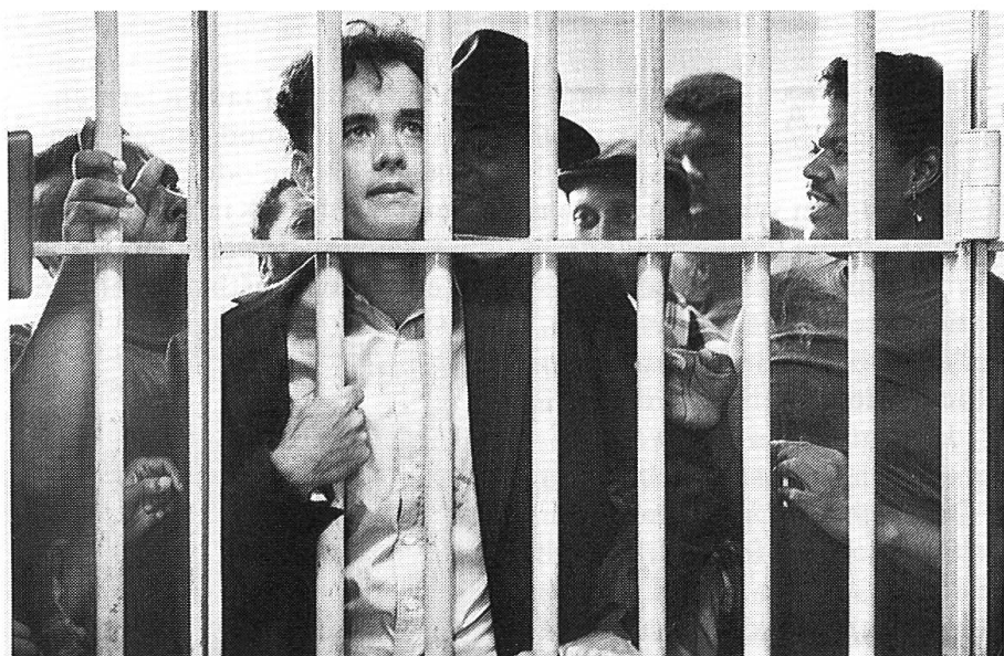
Hochmut kommt vor dem Fall: Der Sturz vom «Meister des Universums» Sherman McCoy, gespielt von Tom Hanks.

alle gesellschaftlichen Gruppierungen dieser Mentalität verschrieben haben, dass der «Tanz um das goldene Kalb» zu einem blindwütigen Amoklauf geworden ist. Unterstützung findet De Palma durch zwei glänzende Hauptdarsteller, wobei Tom Hanks einer der wenigen Komiker ist, die die Gratwanderung zwischen weltgewandter Überheblichkeit und linkischer Hilflosigkeit überzeugend beherrschen. Bruce Willis legt seinen Journalisten so differenziert an, dass man bei allem Zynismus, den er an den Tag legt, Hochachtung vor ihm haben muss. Er ist nicht nur der einzige, der Mitleid