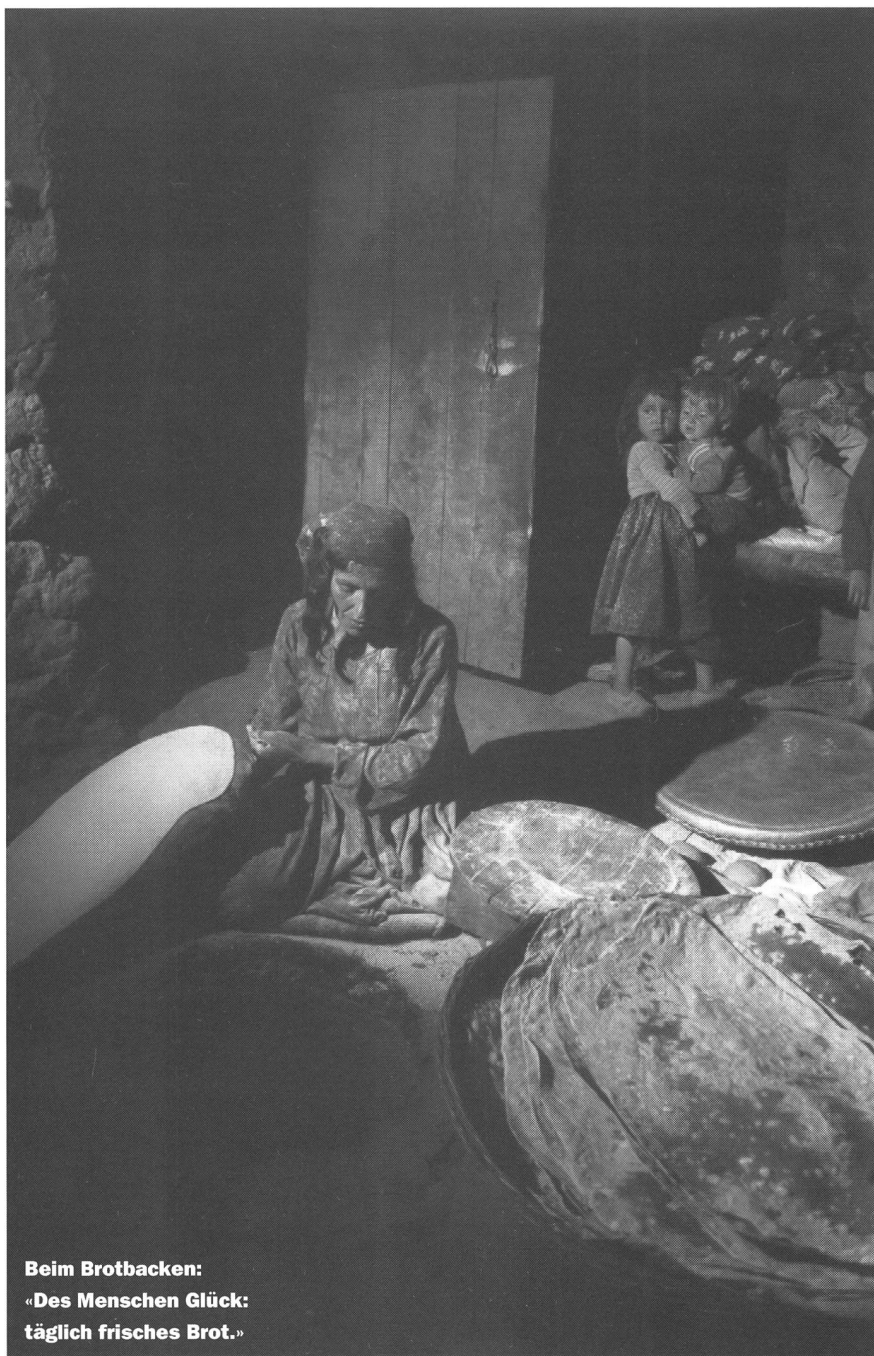
Beim Brotbacken: «Des Menschen Glück: täglich frisches Brot.»

einem Film den Bildern ihren Wert zurückgeben, entdecken, wie langsam die Bilder laufen müssen, bis wir die Menschen in ihnen nicht mehr als Zeichen wahrnehmen. Einhalten - bei meinen Augen!