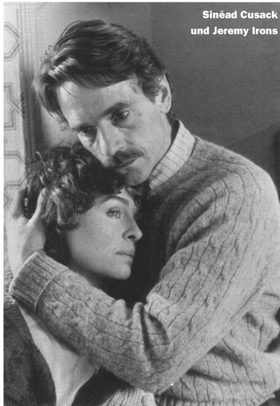
Sinéad Cusack und Jeremy Irons

Graham Swift (deutsch im Claassen Verlag, Düsseldorf, erschienen), den Stephen Gyllenhaal etwas bemüht anspruchsvoll verfilmt hat, zwar sicher nicht zum ersten Mal in seinem langen langweiligen Lehrerleben – als Inhaber eines Jobs also, der sicher einmal als gut gegolten hat, der