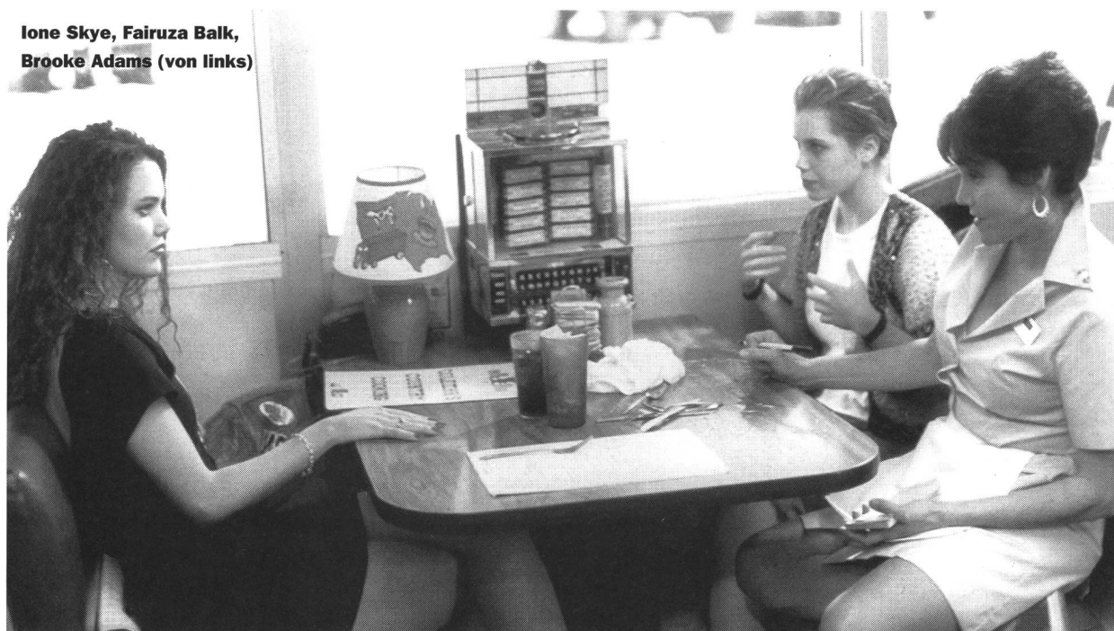
Ione Skye, Fairuza Balk, Brooke Adams (von links)

Was bietet der Stoff nicht an ideologischen Fallstricken! Doch ist die Regis-