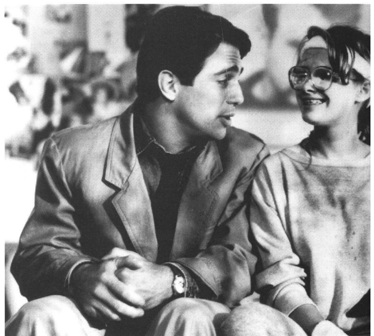
Verwandlung der unattraktiven Brillenträgerin...

Für die Erklärung oder Beschreibung einer vielleicht anders gearteten weiblichen Schaulust kann man auch Freuds Konzept von der potentiellen Trennung der Sexual- und Selbsterhaltungsinstinkte im Schautrieb heranziehen. 24 Das Auge dient ebenso