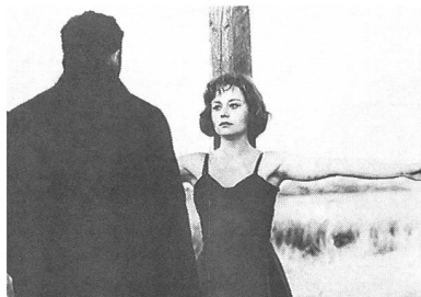
«Rocco e i suoi fratelli»

Regie: Howard Hawks (USA 1948), mit John Wayne, Montgomery Clift, Walter Brennan. - Ein autokratischer Rancher muss einsehen, dass die alten Ideale des «Wilden Westens» neuen Werten weichen müssen. Hawks verbindet in seinem ersten grossen Western epische