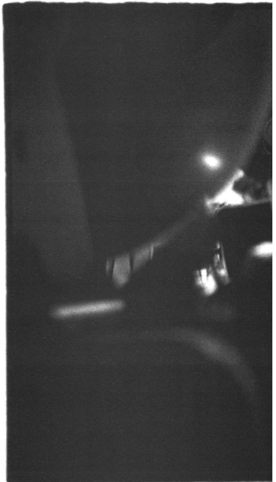
*(Bilder S. 21, 22, 23: Zoom-Dokumentation)

D as Wissen um einen «verbotenen» weiblichen Blick, insbesondere angesichts der «Macht» des Gesetzes und der Tradition, wird schon in Lewis Carrolls 1865 erschienenem Buch «Alice's adventures in Wonderland» schon dem kleinen Mädchen in den Mund gelegt – eine folgenreiche Sozialisation für das Bild und den Blick der Frauen wird in der Episode angesprochen, in der Alice in Begleitung einer Katze auf den König trifft. Die Katze mustert diesen unverhohlen und neugierig. Das stürzt den König in grosse Unsicherheit und er herrscht das Tier an: «Don't be impertinent, and don't look at me like that!» Daraufhin meint Alice erklärend und entschuldigend: «A cat may look at a king...» 1 – und man möchte ergänzend hinzufügen: eine Frau jedoch nicht.