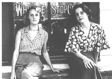
«Fried Green Tomatoes»

(Sieben Tage in Ghana) Regie: Ghana Tourist Development, Accra (Ghana 1992). - Von der Hauptstadt Accra ausgehend, führt der Dokumentarfilm in all die schönen Regionen Ghanas: von den botanischen Gärten Aboris zum Fluss Volta, vom Regenwald Zentralghanas in die Küstengebiete. Handwerker werden bei der Arbeit beobachtet, und es werden Einblicke in das kulturelle und soziale Leben gewährt. - Film Institut, Bern.