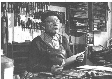
«Die plötzliche Einsamkeit des Konrad S.»

Regie: John Ford (USA 1956), mit John Wayne, Jeffrey Hunter, Vera Miles. - In diesem von vielen als bester Western John Fords bezeichnete Kultfilm verkörpert John Wayne einen einsamen Westerner, der jahrelang einen Indianerstamm verfolgt, der seine kleine Nichte verschleppt hat. Hinter der Oberfläche des spröden «einsamen Cowboys» werden Verzweiflung und Sensibilität und die Sehnsucht nach Liebe und Geborgenheit sichtbar. - 21.30, ORF 1.