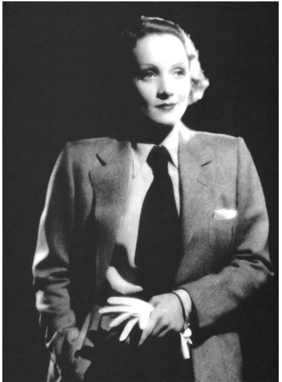
Der Erfolg Marlene Dietrichs bei Frauen und ihr bei einem Teil der Männer geerntetes Missfallen gründet nicht zuletzt auf ihre schillernde androgyne Ausstrahlung.

In der feministischen Filmtheorie interessierte man sich