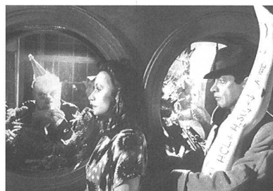
«Le petit criminel»