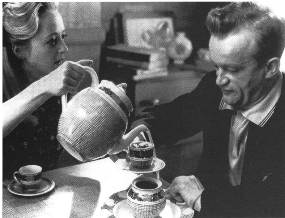
Die Brillenträgerin verliert ohne ihre Sehhilfe die Kontrolle und die Übersicht (Delicatessen von Jean- Pierre Jeunet und Marc Caro, Frankreich 1991)