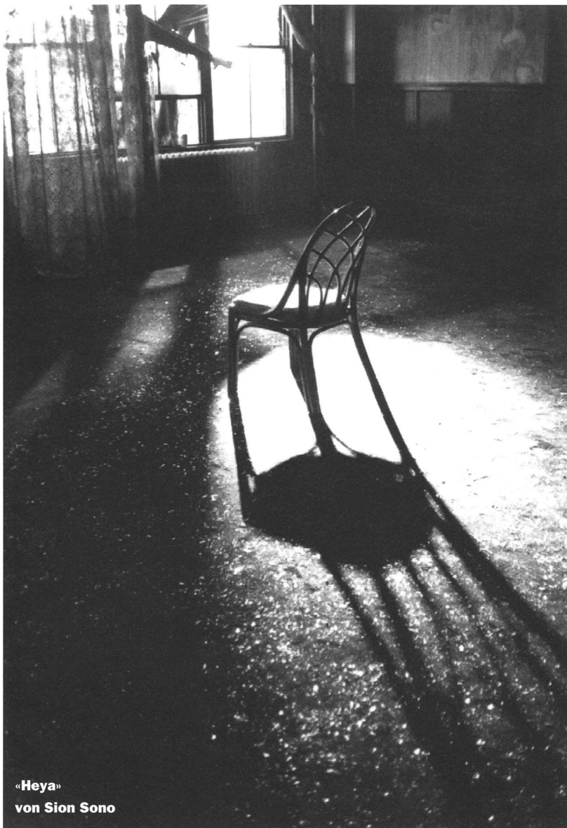
«Heya» von Sion Sono

Zuhören und Beobachten, sich über die Homosexualität seines Sohnes ins Bild setzen konnte. Er bittet Simon, niemandem etwas davon zu sagen. Vor allem nicht seiner Frau. An der Pressekonferenz erklärt der Regisseur seinen Film den anwesenden Journalisten höflich und ohne gefragt zu werden von A bis Z.