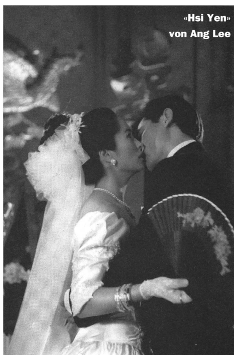
«Hsi Yen» von Ang Lee

eine mögliche Erklärung für die Tat zu finden. Die Spur führt zu einem Mädchen, in das Guillaume unglücklich verliebt war. Nach der ersten Begegnung mit Miren kann auch Ismaël ihren schönen Hals nicht mehr vergessen... Doillon gelingt ein wunderbares Portrait von heuti-