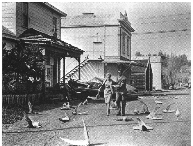
«The Birds» (1963) von Alfred Hitchcock

Ein Klassiker des Thrill hat genau dies zum Thema: die Kontrolle im Rahmen einer ganz normalen Ehe. In Polanskis « Rosemary's Baby » (1968) scheint es vordergründig zwar um so etwas Outriertes wie Zeugung und Geburt des Antichrist zu gehen; doch wenn man das Augenmerk auf die Ehespiele der Protagonisten richtet, wird rasch einmal deutlich, dass jene quasi metaphysische Ebene keineswegs wörtlich zu nehmen ist. Die Ehe zwischen Guy und Rosemary bildet die typische Versorgungskiste: Er bastelt an seiner Karriere herum, sie hat das Nestchen warmzuhalten für den Fall, dass der gestresste Eheherr doch einmal auszuspannen geruht. Das füllt nicht aus – selbstverständlich; so macht er ihr, damit sie was zum Rum-