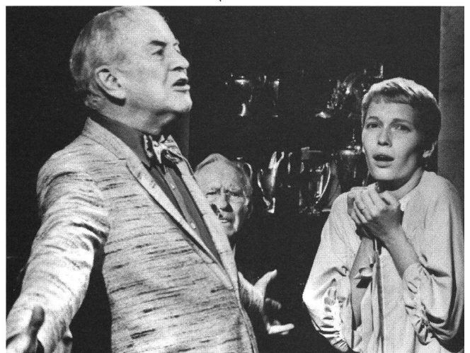
«Rosemary's Baby» (1968) von Roman Polanski

spielen hat, ein Kind. Guy bestimmt auch die sozialen Kontakte; er schneidet seine Frau zielbewusst aus ihrem bisherigen Beziehungsnetz heraus und versucht, sie in den Rahmen jener Sekte einzubinden, die für ihn so etwas wie eine Ersatzfamilie darstellt. Rosemary wird Schritt für Schritt isoliert und sämtlicher Entscheidungsbefugnisse beraubt; am Ende dieser systematischen Entmündigung wird sie nicht einmal mehr imstande sein, ihre Lektüre frei zu bestimmen.