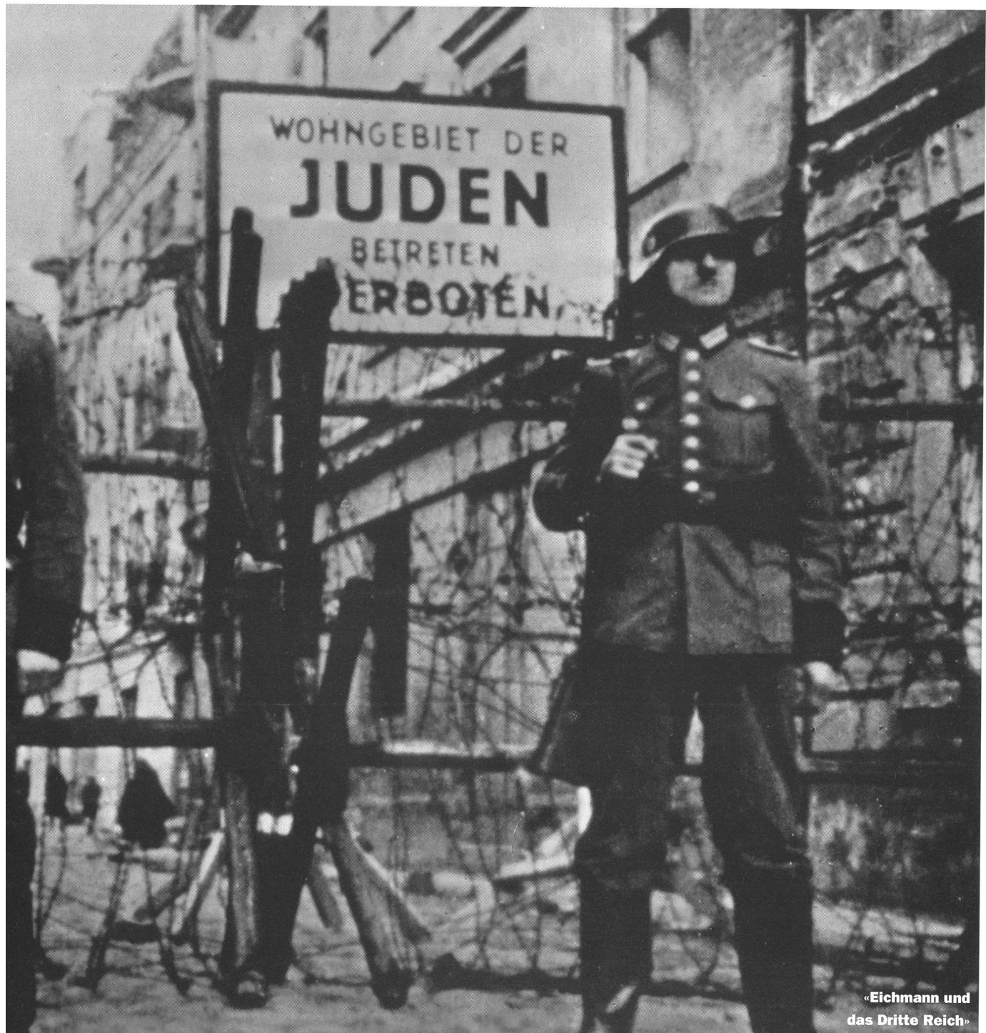
«Eichmann und das Dritte Reich»