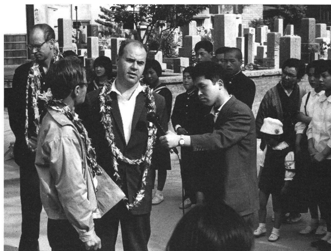
«Wähle das Leben»: Erwin Leiser in Hiroshima