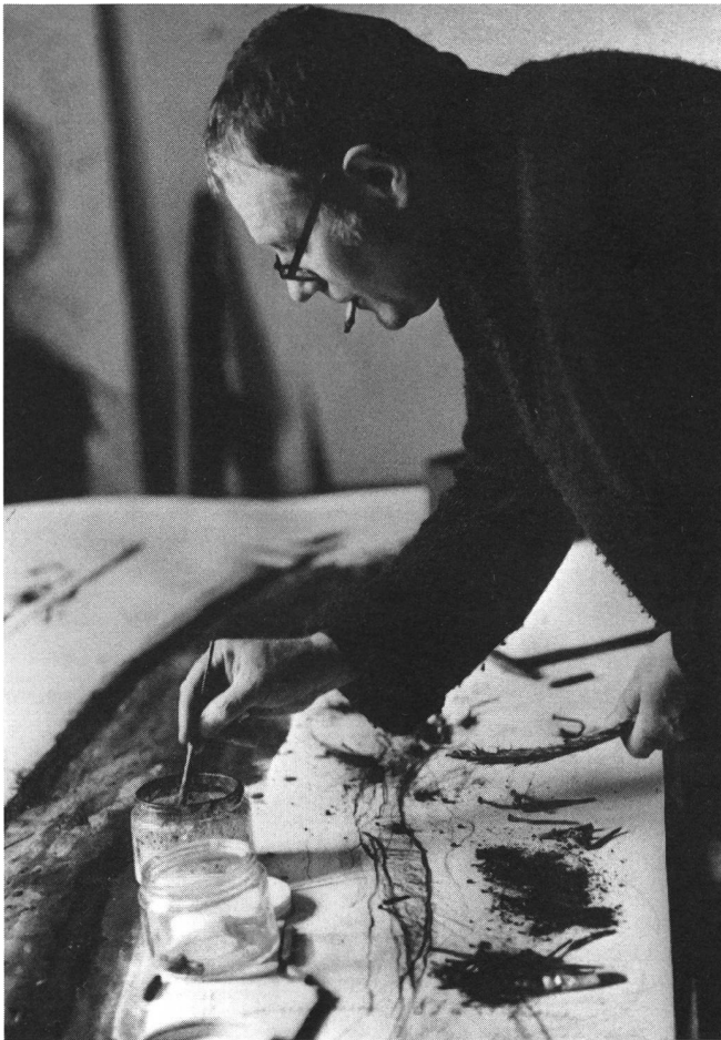
«Erde Schatten Stein – Rolf Iseli»

nicht einfach filmisch reproduziert, vielmehr zeigt die Kamera diese Bilder, wie man sie so sonst nicht sieht – sie macht deren Vielschichtigkeit sichtbar, vermittelt das Erlebnis eines Bildes mit eigenen filmischen Bildern, die im Betrachter des Films ihrerseits wieder Bilder auszulösen bestimmt sind. Letztlich besteht das Ziel darin, Freude an den Bildern der Maler, an den Skulpturen der Plastiker auf Zuschauerinnen und Zuschauer zu übertragen.