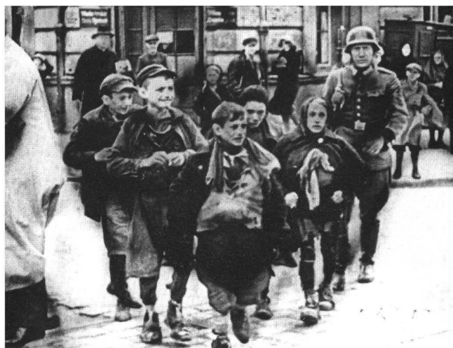
«Mein Kampf»: Opfer und Täter