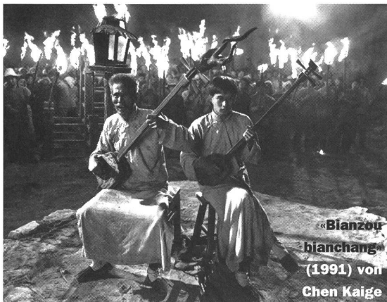
«Bianzou bianchang» (1991) von Chen Kaige

sen Schilffeld wohnt, jede Nacht in blinder Obsession die wogenden Halme. Brillant versteht es Shindo, das optische Schauspiel der Halme auf Celluloid zu bannen, oft arbeitet er mit Nahaufnahmen des übermannshohen Schilfes und des sich kräuselnden Wassers und erzielt so eine fast grafische Wirkung der bewegten Elemente. Die Gefühlswalungen der Liebenden scheinen sich in der Natur zu multiplizieren, das Schilffeld scheint ihnen seelenverwandt zu sein.