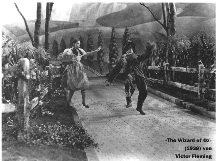
«The Wizard of Oz» (1939) von Victor Fleming

Dass es auch heutzutage Menschen gibt, die auf den Wind angewiesen sind, wie einst die Müller in ihren Windmühlen, die Matrosen auf ihren Seglern, zeigt der französische Ethnograph Jean Rouch. In seinem fiktiv-dokumentarischen Film « Madame L'eau » (Niederlande/Frankreich 1992) besinnen sich drei Bauern aus dem Niger in ihrer Notlage auf den Wind. Ihre Felder sind ausgetrocknet, da der Wasserstand des Nigers von Jahr zu Jahr sinkt. Auf dem sandigen Boden stehend, betrachten sie eine Delfter Kachel mit dem Motiv einer jener wasserpumpenden Windmühlen, die die Besiedlung der unter dem Wasserspiegel liegenden Landschaften Hollands überhaupt erst ermöglichten. Ihr Traum wird wahr: Im