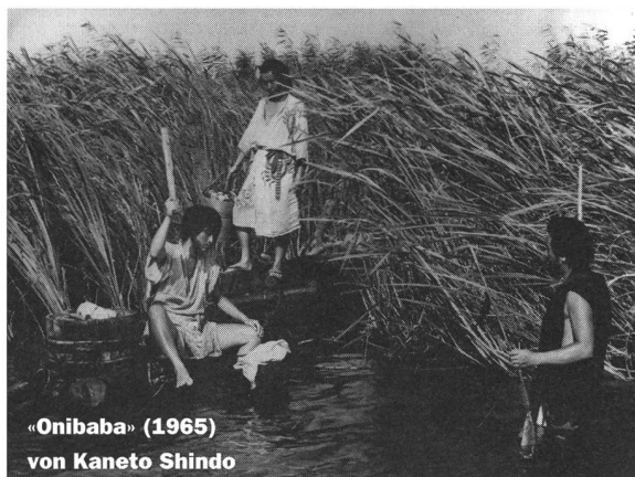
«Onibaba» (1965) von Kaneto Shindo

dramen, auf orkanumpeitschten Schiffen auf Meeren aller Herren Länder von Frank Lloyds « Mutiny on the Bounty » (USA 1935) bis Roman Polanskis « Pirates » (Frankreich 1986), oder in ausgewachsenen Katastrophenfilmen wie