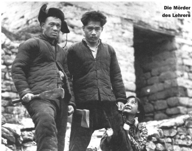
Die Mörder des Lehrers

Wie «Qiu Ju» spielt «Ein blutroter Morgen» im ländlichen China der Gegenwart: in einem armen Bauerndorf, das von der «Welt» wie abgeschnitten ist und vom Dorfvorsteher autokratisch beherrscht und verwaltet wird. Aber während bei Zhang Yimou die Bäuerin Qiu Ju sich gegen die Willkür des Dorfvorstehers auf-