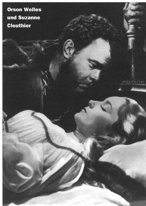
Orson Welles und Suzanne Clouthier

Jahre alte Nitro-Negativ jedoch in einem Lagerhaus der 20th Century Fox in Ogdensburg, New Jersey, auf. Dort lagerten zehn Filmrollen, der kombinierte Lichtton sowie die Musik- und Geräuschbänder. Eine vorsichtige, mit modernster Bild- und Tontechnik ausgestattete Restaurierung konnte beginnen. Das