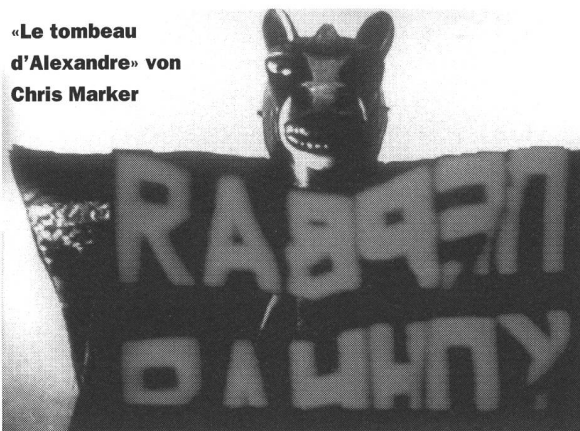
«Le tombeau d'Alexandre» von Chris Marker