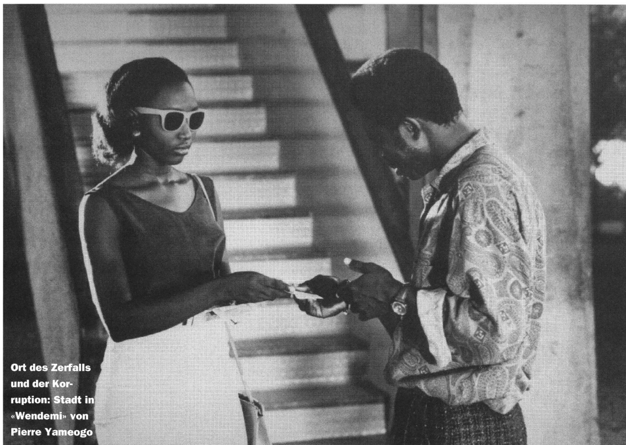
Ort des Zerfalls und der Kor- ruption: Stadt in «Wendemi» von Pierre Yameogo

Mehrere neuere und neueste Filme thematisieren das Versagen öffentlicher Einrichtungen. In «Guelwaar» (Ousma-