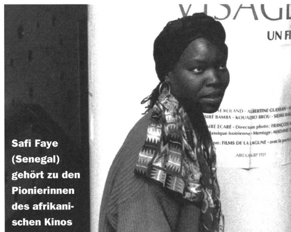
Safi Faye (Senegal) gehört zu den Pionierinnen des afrikanischen Kinos