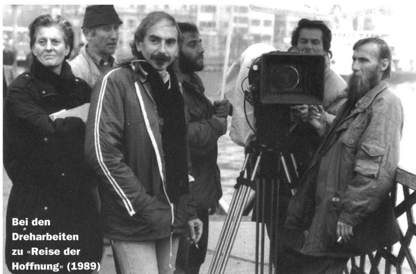
Bei den Dreharbeiten zu «Reise der Hoffnung» (1989)

Walo Deuber ist Chefredaktor des Kinomagazins «CloseUp» beim Teleclub. Transkription: Christof Stillhardt