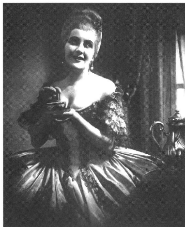
"Tartuff" (1925) von F. W. Murnau

Verzicht auf Zwischentitel machte die Filme lyrischer und freier, gab der Phantasie wilde Möglichkeiten. Die Kritiker der Branchenzeitschriften nahmen Anstoss, sie schrieben von Langeweile, ihnen fehlten die Gags, die Witze, die Ausrufezeichen. Die Kollegin Thea von Harbou teilte mit: «Ein leidender oder beglückter Mensch braucht auf der Leinwand überhaupt nichts zu tun, er kann in Unbeweglichkeit verharren und doch erreichen, dass dem Zuschauer vor Spannung der Atem wegbleibt.» Thea von Harbou, die auch Filmregisseurin war («Elisabeth und der Narr», 1933; «Hanneles Himmelfahrt», 1934), erwähnt das Schachspiel, dessen Spannung. Arnolt Bronnen über Carl