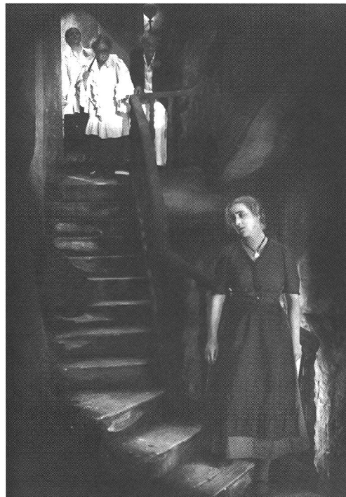
« Hintertreppe » (1921) von Leopold Jessner