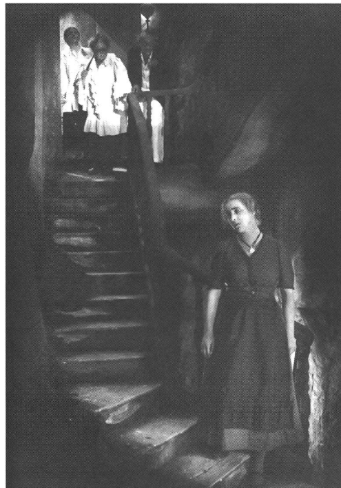
« Hintertreppe » (1921) von Leopold Jessner