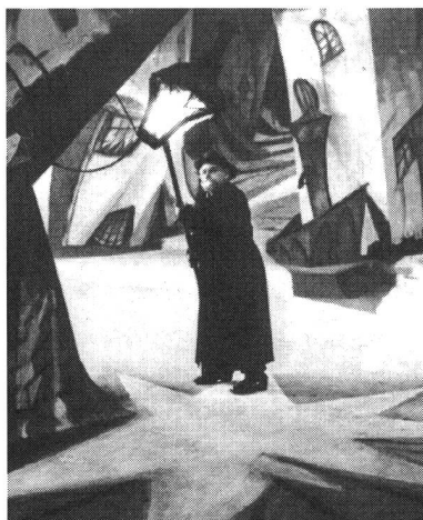
«Das Kabinett des Dr. Caligari» (1919) von Robert Wiene