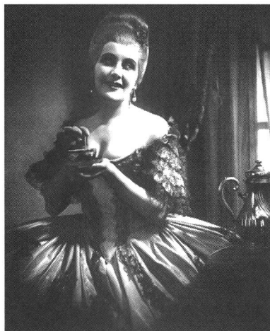
"Tartüff" (1925) von F. W. Murnau

Verzicht auf Zwischentitel machte die Filme lyrischer und freier, gab der Phantasie wilde Möglichkeiten. Die Kritiker der Branchenzeitschriften nahmen Anstoss, sie schrieben von Langeweile, ihnen fehlten die Gags, die Witze, die Ausrufezeichen. Die Kollegin Thea von Harbou teilte mit: «Ein leidender oder beglückter Mensch braucht auf der Leinwand überhaupt nichts zu tun, er kann in Unbeweglichkeit verharren und doch erreichen, dass dem Zuschauer vor Spannung der Atem wegbleibt.» Thea von Harbou, die auch Filmregisseurin war («Elisabeth und der Narr», 1933; «Hanneles Himmelfahrt», 1934), erwähnt das Schachspiel, dessen Spannung. Arnolt Bronnen über Carl