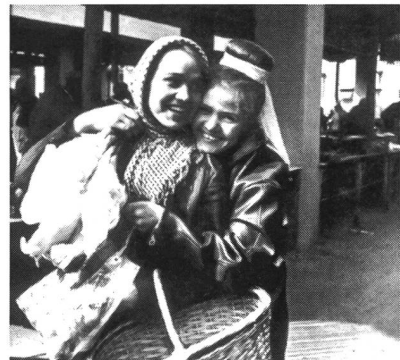
«Kurze Begegnungen» (UdSSR 1967) von Kira Muratowa