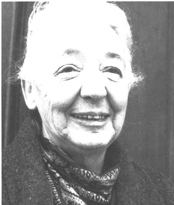
Reni Mertens leistete als erste Frau einen namhaften Beitrag zum Neuen Schweizer Film