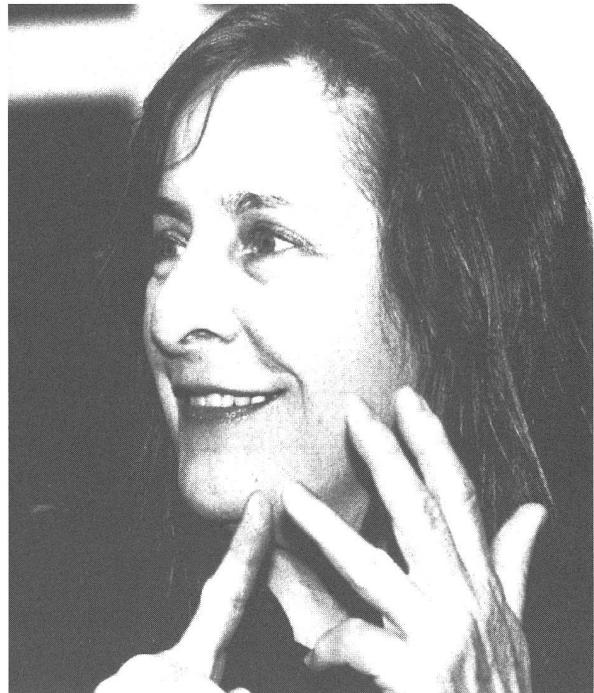
Tula Roys Filme pflegen einen kontinuierlichen und direkten Dialog mit der Frauenbewegung

Lohnungleichheit, Mutterschutz, sexuelle Belästigung weder damals noch später als Thema aufgegriffen wird. Nur das Werk einer einzigen Schweizer Filmemacherin, Tula Roy, pflegt den kontinuierlichen und direkten Dialog mit der Frauenbewegung, der im Zeitalter der Ausdifferenzierung der feministischen Position auch generationsübergreifende Aspekte umfasst.