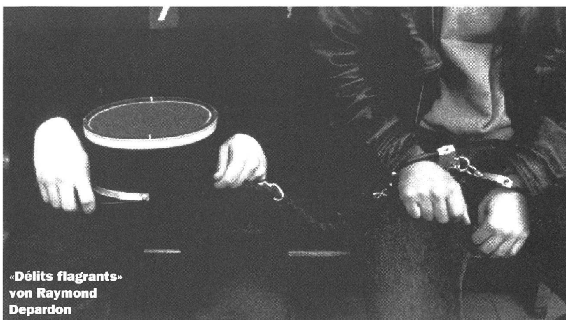
«Délits flagrants» von Raymond Depardon

Es sind diese Filme, «Tianguo niezi», «Délits flagrants», «Rhythm Thief» oder «L'appât», die das Leben eines Filmkritikers angenehm machen. Man findet sie fast nur noch an einem Filmfestival. An diesem fernen Ort, wo die kulturelle Vielfalt noch kein Phantom ist. ■