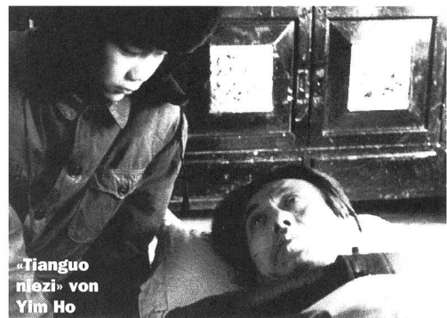
«Tianguo niezi» von Yim Ho

die Geschichte dieser Familie. Am Schluss, nachdem die Polizei den Leichnam ausgegraben hat, kann anhand einer Knochenanalyse festgestellt werden, dass der Vater vergiftet worden ist. Die Mutter und ihr zweiter Mann, der am Mord mitschuldig ist, werden zum Tode verurteilt. Die beiden haben eine zehnjährige Beziehung im Wissen um dieses