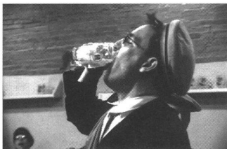
«Bursche, Fux und Bierverschiss» von Steff Bossert