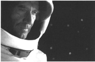
«Der Astronaut» von Pierre Mennel