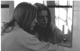
«Idyllische Landschaft – oder die Erfindung der Freiheit» von Judith Rutishauser