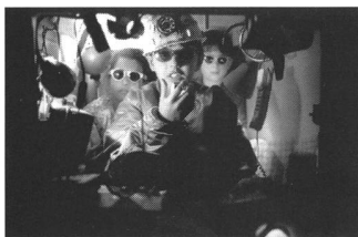
«Nascondiglio – Das Versteck» von Roberto Di Valentino

von «Projektarbeit» stattfindet, wird von Fachleuten aus der Filmbranche erteilt. Sie vermitteln Grundlagenkenntnisse in den Bereichen Kamera, Licht, Ton und Montage. Einmal jährlich werden Übungsfilme (16mm) und -videos individuell oder in Gruppen erarbeitet. Der Einstieg erfolgt über einen Animations- oder Experimentalfilm, gefolgt von Spiel- und Dokumentarfilm. In weiteren Seminaren werden spezifische Techniken wie Dé-coupage vertiefend behandelt. Theorieveranstaltungen finden zwischen den mehrwöchigen Blockseminaren statt. Dort werden die Fächer Kunst- und Filmgeschichte, Kulturtheorie, Sprache/Drehbuch, Filmwirtschaft, Medienpolitik sowie Recht gelehrt.