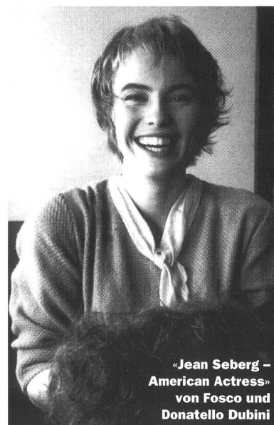
«Jean Seberg – American Actress» von Fosco und Donatello Dubini

Im Dokumentarfilm «Motor nasch» porträtiert Sabine Gisiger und Marcel Zwingli fünf Frauen und ein Mädchen aus Moskau. Die älteste hat im Jahre 1917 als damals junge Mutter die Oktoberrevolution erlebt. Die jüngste – das Mädchen – ist heute rund 11 Jahre alt. «Motor nasch» besteht zur Hauptsache aus gelungenen Interviews mit den fünf Moskauer Damen. Daneben werden Fotos und kurze Filmausschnitte eingebildet, Stationen der offiziellen sowjetischen Geschichte (Stalin-, Breschnew-, Gorbatschow- und Jelzin-Ära) passieren die Leinwand. Die Lebensgeschichte der Frauen im Film haben natürlich mit der Historie viel zu tun, sie erzählen aber eine Art «inoffizielle» Geschichte, ihr ganz persönliches Leben eben. Da die Porträ-