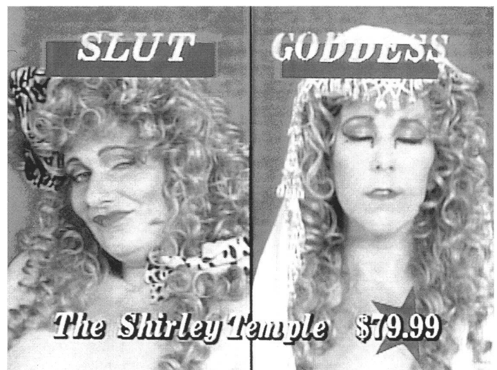
« Sluts and Goddesses »: Aids darf Sex nicht verhindern.

Auch hier findet sich die neue sexuelle Ideologie, die die Schwulen- und Lesbenszene in Reaktion auf die Bedrohung entwickelt hat: Aids darf Sexualität nicht verhindern – im Gegenteil. Allerdings sieht der soziale Hintergrund bei den Frauen anders aus. Lesbische Sexualität wurde nie in diesem Ausmass als gesellschaftlicher Affront betrachtet wie schwule Sexualität; sie galt und gilt bis heute vornehmlich als weiblich sanft und harmlos.