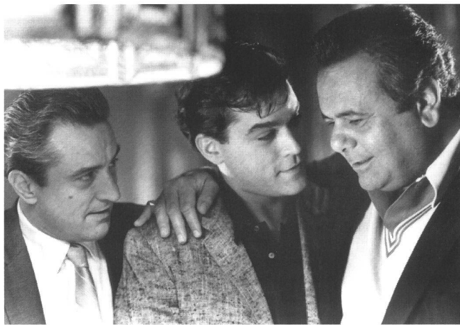
«GoodFellas»: Abgebrühtheit bezüglich Gewalt und Niedertracht

Zum achten Mal hat Scorsese unterdessen mit Robert De Niro in der Hauptrolle gedreht, der selber in der Lower East Side, unweit von der Elizabeth Street, aufwuchs. Aber sein wahres anderes Ich hat Scorsese bemerkenswerterweise weniger im (oft unheimlich) vielgesichtigen «Italiener» De Niro gefunden, sondern von Anfang an im sichtlich stabileren, handfesteren Harvey Keitel. Sein Entdecker und er, sagt Keitel, der polnische Jude aus Brooklyn, hätten einander von Anfang an als Brüder empfunden, als Mitglieder einer Art von namenloser Geheimgesellschaft.