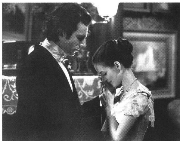
«The Age of Innocence»: gebrochene Üppigkeit

So sucht er immer nachdrücklich und auf verschiedenen Wegen (aber ohne etwa die Sprache seiner Grosseltern zu erlernen) die Rückkopplung, auch physischer Art, mit dem Ursprungsland seiner Familie. Polizzi Generose heisst der Ort, aus dem sie stammt. «Italien ist in einem gewissen Sinn meine Heimat», bekennt Scorsese. «Das